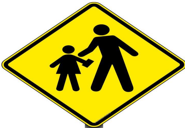
A-33a Área escolar

A CRIANÇA DEVERÁ CAMINHAR LIVREMENTE PELO CIRCUITO, AO AVISTAR A PLACA ELA DEVERÁ OBEDECÊ-LA.