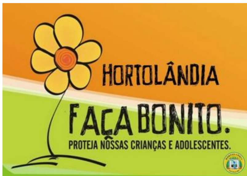
IMAGEM DISPONÍVEL EM: https://portalhortolandia.com.br/ . ACESSO EM: 17/05/2021

A IDENTIDADE É UM PROCESSO CONTÍNUO, QUE FAZ PARTE DO COTIDIANO NA PRIMEIRA ETAPA DA EDUCAÇÃO INFANTIL, NA CONSTRUÇÃO DO INDIVÍDUO COMO UM SER GLOBAL, POR ISSO FAZ SE NECESSÁRIO TRABALHAR VÁRIOS ASPECTOS, NOS PRÓXIMOS DIAS IREMOS ESTUDAR SOBRE A CAMPANHA CONTRA O ABUSO E EXPLORAÇÃO SEXUAL DE CRIANÇAS E ADOLESCENTES.