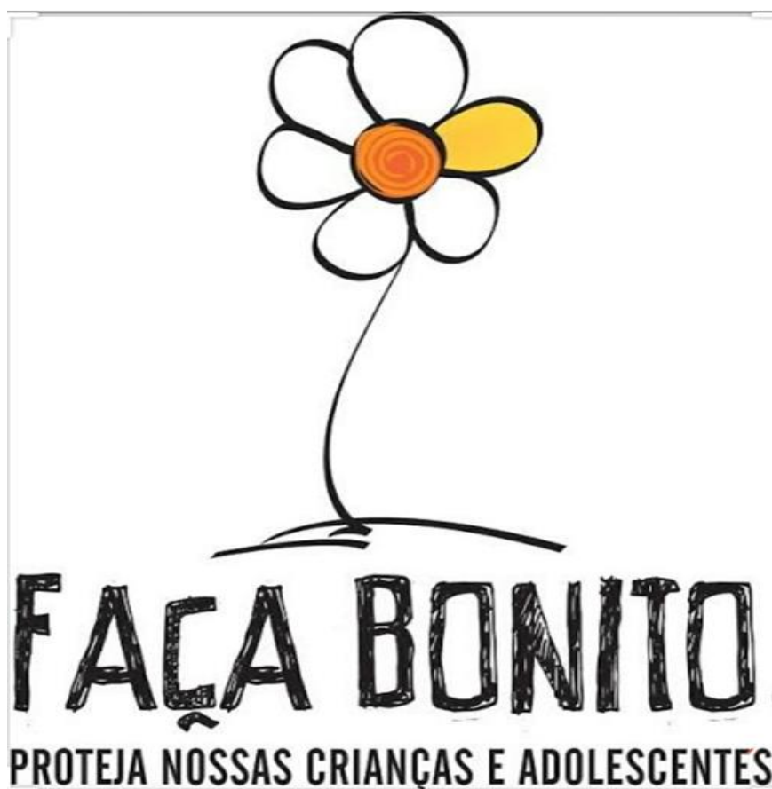
IMAGEM RETIRADA D SITE WWW.PREFEITURA.SP.GOV.BR 20/05/2021

VAMOS FAZER BOLINHAS DE MASSINHA NAS CORES QUE REPRESENTA A FLOR AMARELA E COLE DENTRO DAS PÉTALAS COM UM PINGO DE COLA BRANCA NO PAPEL. (COLOCAR DENTRO DE UM SAQUINHO PLÁSTICO PARA QUE NÃO RESSEQUE A MASSINHA).