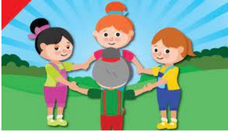
FIGURA RETIRADA WWW.ESCOLAEDUCACAO.COM.BR /14/06/2021.