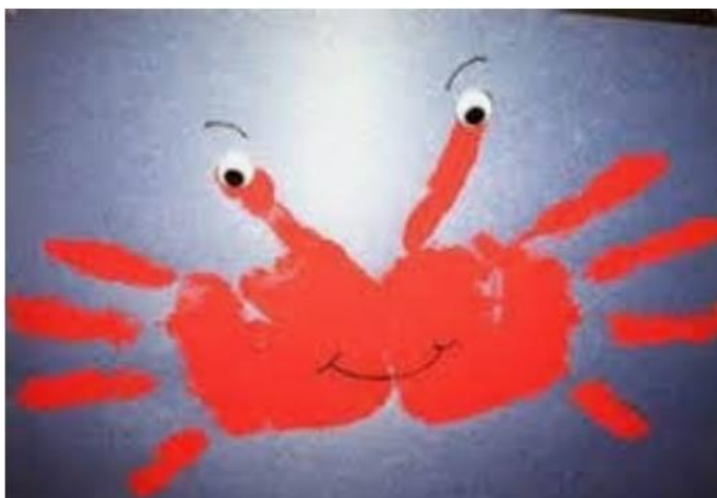
FIGURA RETIRADA DO PIN LORENA VIANA