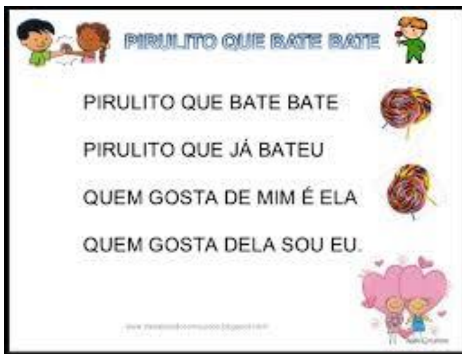
FIGURA ACESSADA WWW.ELEMENTARYSCHOOL.NEWSLETTER.COM.BR/15/06/2021

APÓS ASSISTIR A MÚSICA, AGORA É A HORA DE BRINCAR COM A MAMÃE, PAPAÍ, IRMÃO. CLIQUE NO LINK ABAIXO PARA ASSISTIR E VER COMO É A BRINCADEIRA.