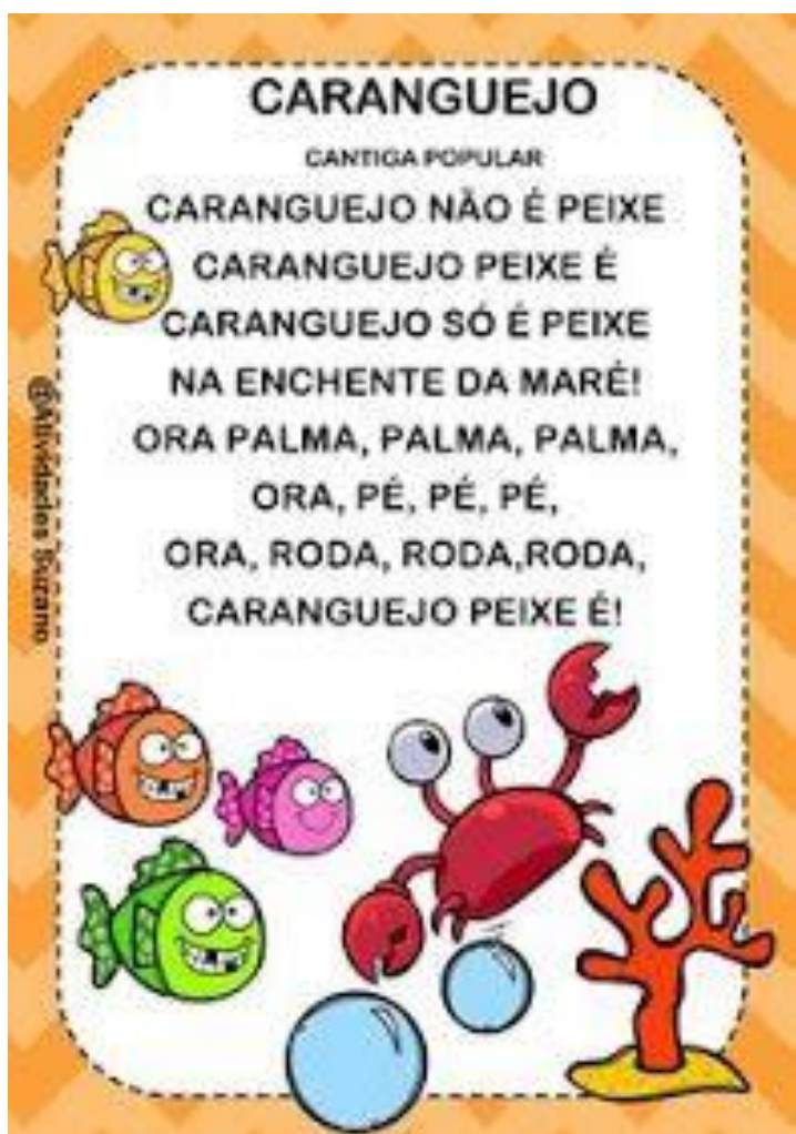
FIGURA ACESSADA NO BLOG WWW.PROFESSORAISABELSANTOS.BLOGSPOT.COM.BR/ FIGURA ACESSADA DIA 14/06/2021.

APÓS ASSISTIR O VÍDEO, DANÇAR, BRINCAR CHEGOU A HORA DE FAZER UM CARANGUEJO.