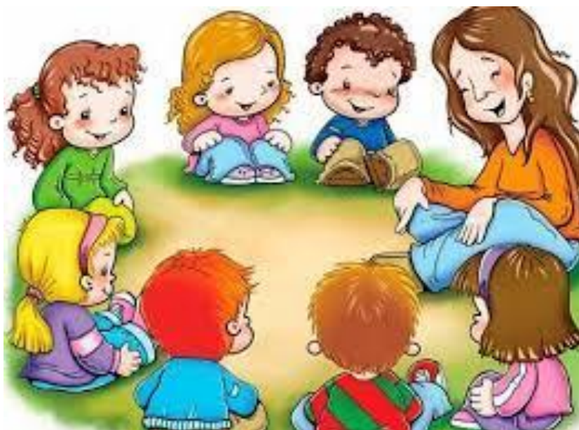
FIGURA ACESSADA NO BLOG WWW.PROFESSORAISABELSANTOS.BLOGSPOT.COM.BR/ FIGURA ACESSADA DIA 14/06/2021.

A CRIANÇA APRENDER A FAZER RODA NESTA IDADE É MUITO IMPORTANTE, TANTO A DANÇA QUANTO SENTAR, POIS NA ESCOLA SENTAMOS EM RODA PARA VÁRIAS ATIVIDADES, SENDO ASSIM AS CRIANÇAS JÁ IRÃO COMEÇAR SE HABITUAR PARA QUANDO VOLTARMOS AS AULAS PRESENCIAIS, POIS É UM HÁBITO NA EDUCAÇÃO INFANTIL.