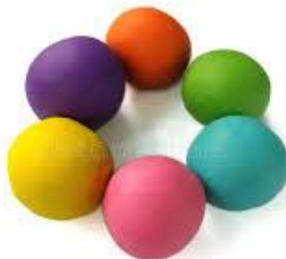
FIGURA RETIRADA DO SITE WWW.DREAMSTIME.COM.BR 14/06/2021

CADA BOLINHA IRÁ REPRESENTAR UMA CRIANÇA, UMA PESSOA QUE ESTÃO DANÇANDO.