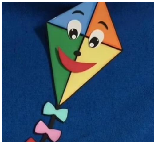
IMAGEM RETIRA DO VÍDEO DA HISTÓRIA “A PIPA E A FLOR” 06/08/2021

A PIPA É UM BRINQUEDO QUE FAZ PARTE DA CULTURA POPULAR E QUE AS CRIANÇAS BRINCAM ATÉ HOJE.