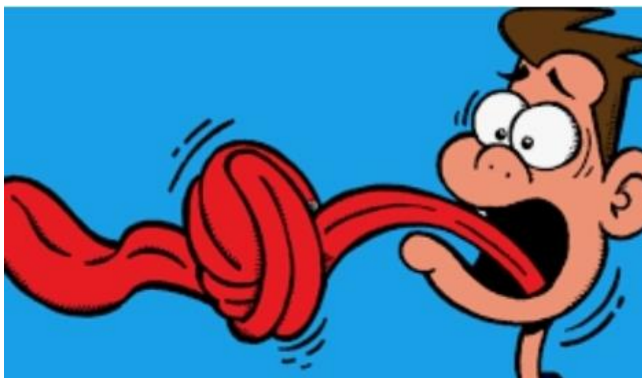
IMAGEM RETIRADA DO SITE WWW.ESCOLAEDUCACAO.COM.BR 06/08/2021

UM TRAVA-LÍNGUA É UMA FRASE FORMADA POR PALAVRAS COM SÍLABAS DIFÍCEIS DE ARTICULAR QUANDO PRONUNCIADAS DE FORMA RÁPIDA. OS TRAVA-LÍNGUAS SÃO USADOS EM BRINCADEIRAS INFANTIS E EM JOGOS POPULARES DE LIGEIREZA E CLAREZA DE ARTICULAÇÃO. ASSIM, DEVEM SER MEMORIZADOS E DITOS COM RAPIDEZ, SEM QUE HAJA TROCAS OU ERROS DE PRONÚNCIA. NOSSAS CRIANÇAS ESTÃO NA FASE DO DESENVOLVIMENTO DA ORALIDADE, PODENDO FALAR DEVAGAR. ESTA ATIVIDADE É APENAS PARA CONHECER A BRINCADEIRA E PARTINDO DELA IREMOS FAZER ARTE HOJE!