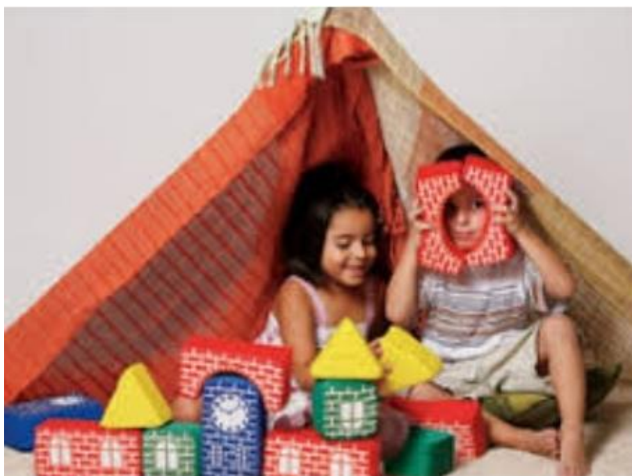
IMAGEM RETIRADA DO SITE WWW.REVISTACRESCER.COM.BR 06/08/2021

APÓS ASSISTIR E RECITAR A PARLENDA, CHEGOU A HORA DE BRINCAR DE CASINHA. MONTE COM LENÇÓIS ENTRE SOFÁ, CADEIRAS UMA CABANINHA, AS CRIANÇAS IRÃO ADORAR.