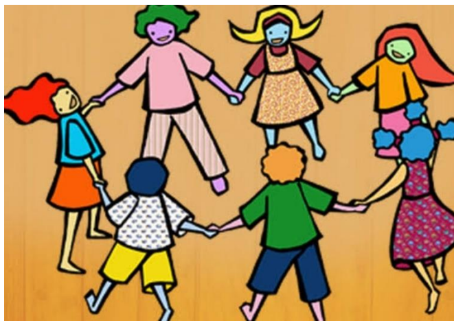
FIGURA RETIRADA DO SITE WWW.TODAMATERIA.COM.BR 06/08/2021

A MAIORIA DAS CANTIGAS QUE CONHECEMOS HOJE EM DIA FIZERAM PARTE DO FOLCLORE BRASILEIRO. PARA APRENDER ALGUMAS CLIQUE NOS LINKS ABAIXO PARA APRENDER.