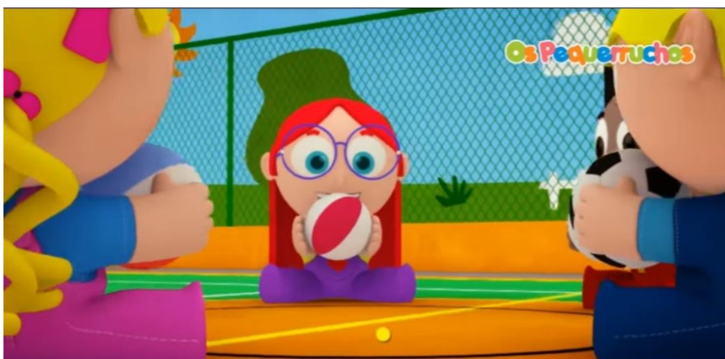
IMAGEM RETIRADA DO VÍDEO UTILIZADO PARA A ATIVIDADE

ESCAVOS DE JÓ É UMA BRINCADEIRA DE RODA QUE PODE USAR BOLA OU UM SAQUINHO DURANTE O CANTO. CLIQUE NO LINK ABAIXO PARA ASSISTIR COMO SE BRINCA.