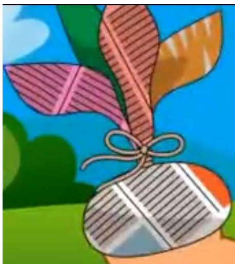
FIGURA RETIRADA DO VÍDEO DA PARLENDA A SER ESTUDADA

A PETECA FAZ PARTE DA CULTURA POPULAR BRASILEIRA E DESDE A MUITO TEMPO AS PESSOAS GOSTAM DE BRINCAR POR SER MUITO DIVERTIDO. PARA SABER MAIS UM POUQUINHO SOBRE A PETECA, CLIQUE NO LINK ABAIXO PARA OUVIR UMA HISTÓRIA.