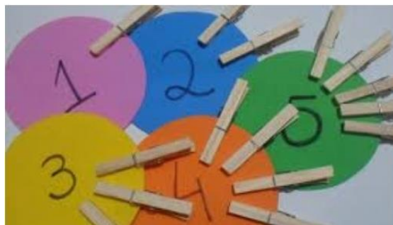
IMAGEM RETIRADA DO SITE WWW.MONOGRAFIAS.BRASILESCOLA.COM.BR 12/08/2021