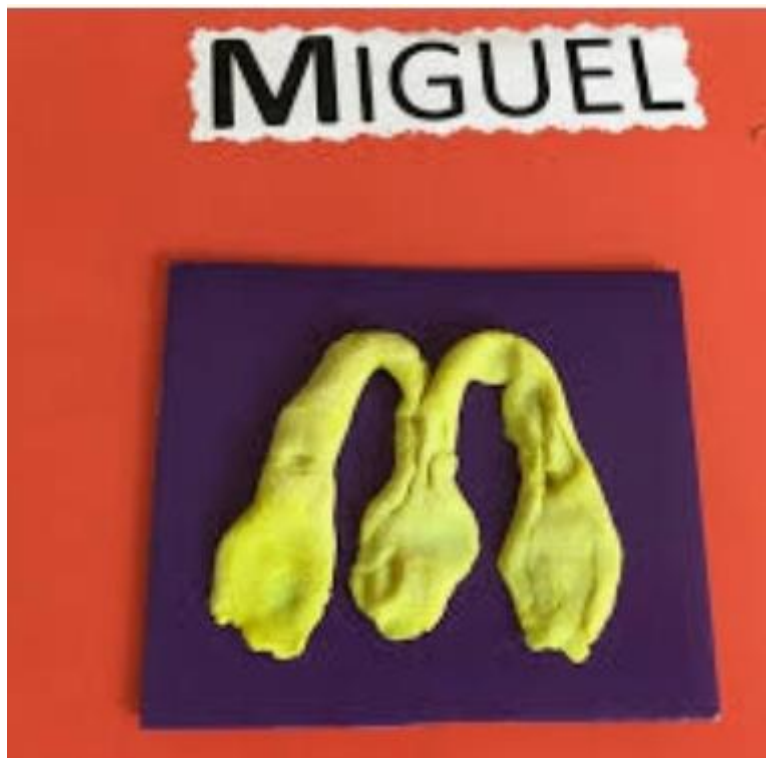
IMAGEM RETIRADA DO SITE WWW.ENSFATIMA.COM.BR 12/08/2021

PEÇO POR GENTILEZA QUE O REGISTRO QUE FIZER DESTA ATIVIDADE INDEPENDENTE SE FOR VÍDEO OU FOTO, ENVIE PARA O WHATS APP DO GRUPO DA NOSSA TURMA.