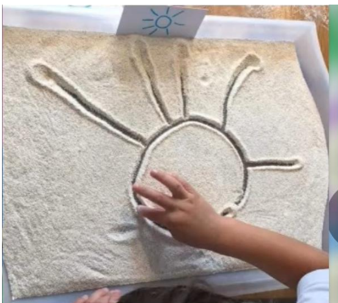
IMAGEM RETIRADA DO VÍDEO UTILIZADO NA ATIVIDADE