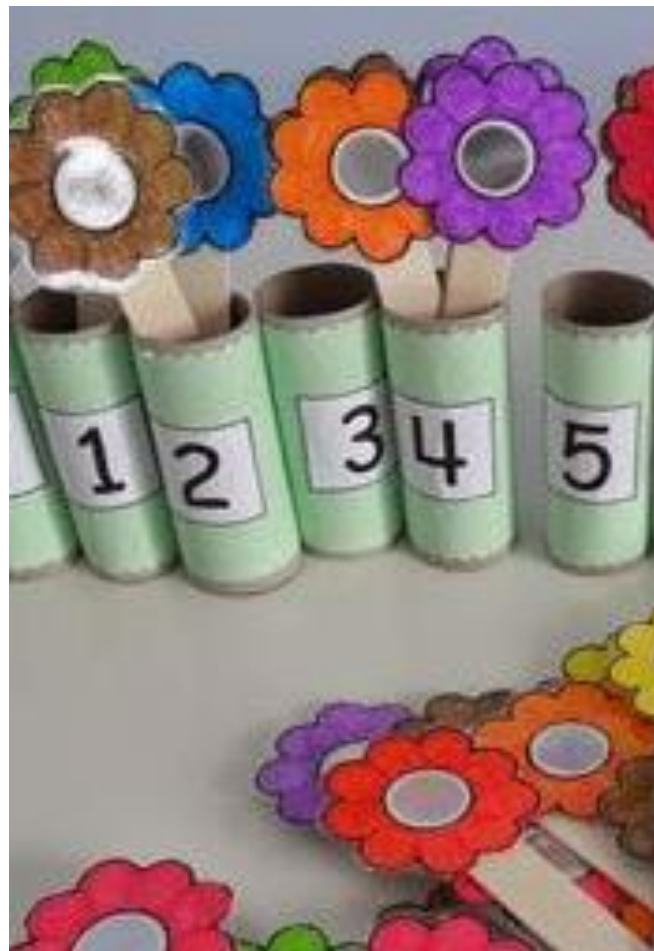
IMAGEM APENAS ILUSTRATIVA SERVINDO DE MODELO PARA A CONFECÇÃO DO MATERIAL. PARA ESTA ATIVIDADE, A CRIANÇA DEVERÁ OBSERVAR O NUMERAL REPRESENTADO NO ROLO, CONTAR AS FLORES E COLOCÁ-LAS DENTRO DO ROLINHO CONFORME NUMERAL, REALIZANDO ASSIM, A RELAÇÃO NUMERAL/QUANTIDADE. A CRIANÇA SEGURA O PALITO DE SORVETE COM O POLEGAR E, O ADULTO, DEVERÁ SEGURAR O ROLINHO PARA QUE A CRIANÇA TENHA ENCAIXÁ-LO CONFORME ESTÁ NA FOTO.