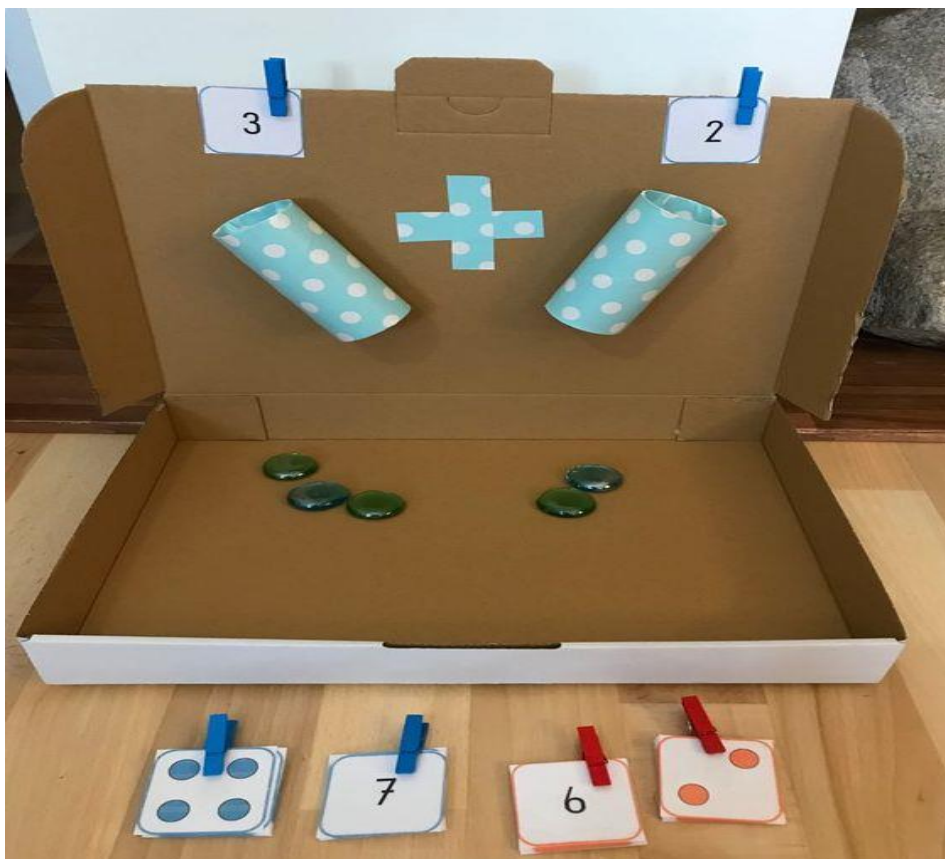
IMAGEM APENAS ILUSTRATIVA SERVINDO DE MODELO PARA A CONFEÇÃO DO MATERIAL. A CRIANÇA DEVERÁ COLOCAR AS TAMPINHAS NO TUBO CONFORME O NUMERAL REPRESENTADO E, NO FINAL, REALIZAR A CONTAGEM TOTAL DAS TAMPINHAS.

https://br.pinterest.com/pin/420945896419337117/