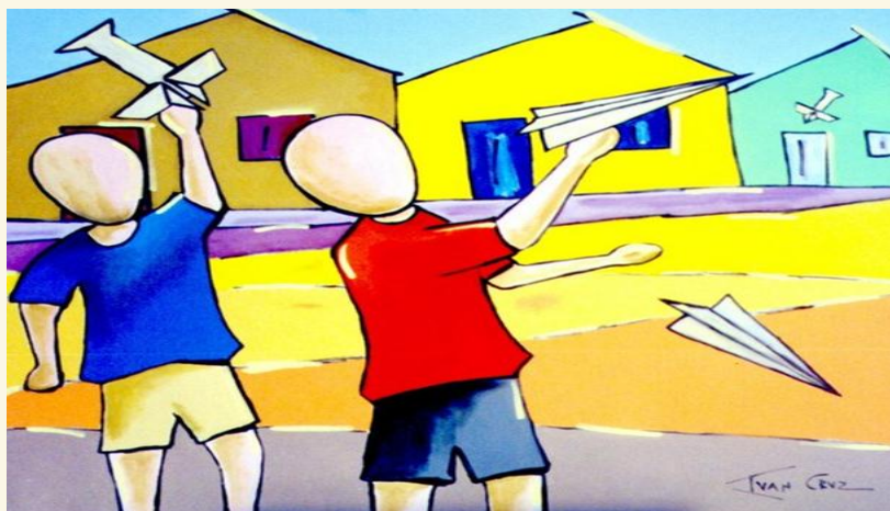
Avião de papel