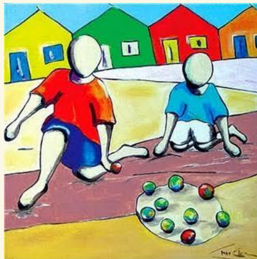
BOLINHA DE GUDE