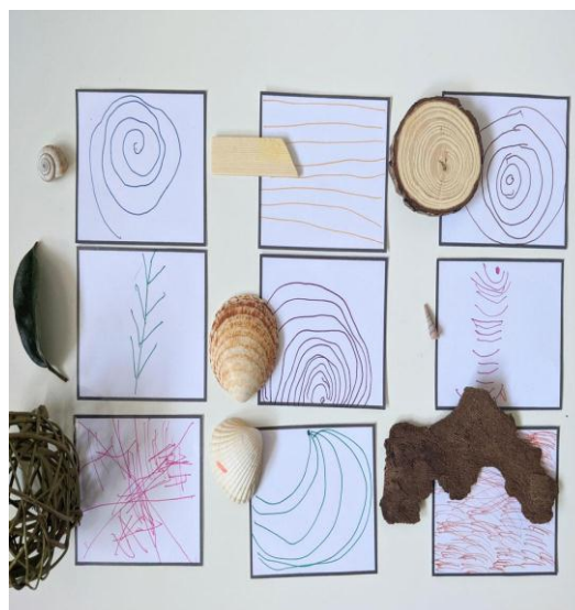
IMAGEM RETIRADA: O desenho da natureza para desenvolver coordenação motora fina (criando com apego.com)