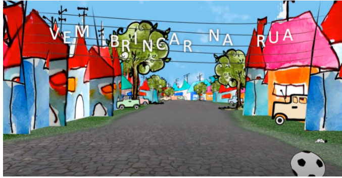
Imagem do vídeo: https://youtu.be/z3LmtVKbGjU acesso em 28/04/21

ESTE VÍDEO FALA SOBRE AS BRINCADEIRAS QUE AS CRIANÇAS FAZEM NA RUA. CONVERSE COM A CRIANÇA AS PESSOAS QUE ELA CONHECE E QUE MORAM NA SUA RUA E O NOME DA SUA RUA. SE TIVER ACESSO À INTERNET O ADULTO DEVE FAZER UMA PEQUENA PESQUISA PARA SABER QUEM É A PESSOA POR TRÁS DO NOME DA SUA RUA. EM SEGUIDA GRAVE UM PEQUENO VÍDEO DA CRIANÇA DIZENDO O NOME DA SUA RUA E QUEM É A PESSOA A QUE SE REFERE A RUA. (SE NÃO TIVER COMO PESQUISAR A CRIANÇA DEVE DIZER SÓ O NOME DA RUA)