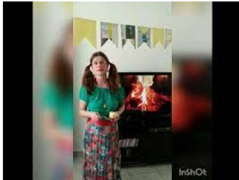
IMAGEM DISPONÍVEL EM: https://youtu.be/Vb4gYvqA2Cs (ACESSADO EM 11/06/21)