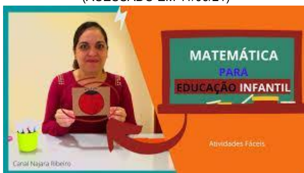
IMAGEM DISPONÍVEL EM: https://www.youtube.com/watch?v=KKNexx9Ufnk ACESSO EM: 11/06/2021.