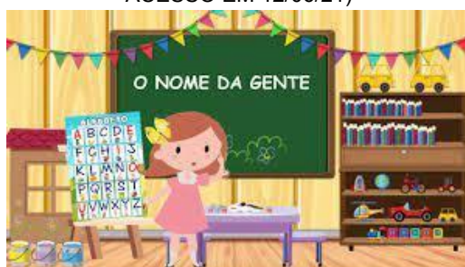
IMAGEM DISPONÍVEL EM: https://www.youtube.com/watch?v=LIEtSEM_jE4 (ACESSO EM 12/06/21)