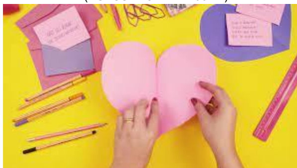
IMAGEM DISPONÍVEL EM: https://youtu.be/L_OC5yhOGP6k ACESSO EM: 11/06/2021.

USE A CRIATIVIDADE E FAÇA UM CARTÃOZINHO BEM BONITO PARA AQUELA PESSOA QUE MAIS GOSTA. PODE SER DE VÁRIOS MODELOS: CORAÇÃO, FLOR, COM PAPÉIS COLORIDOS...É SÓ SOLTAR A IMAGINAÇÃO!