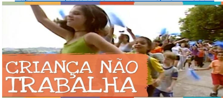
IMAGEM DISPONÍVEL EM: https://i.ytimg.com/vi/lqDOXkKSobM/maxresdefault.jpg Acesso 24/06/2021

https://www.youtube.com/watch?v=lqDOXkKSobM