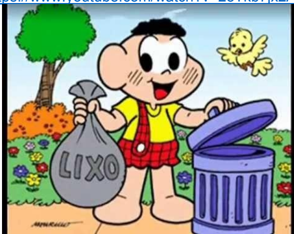
IMAGEM DISPONÍVEL EM: https://i.ytimg.com/vi/2oTkb7jx2Ak/sddefault.jpg Acesso 24/06/2021

https://www.youtube.com/watch?v=2oTkb7jx2Ak