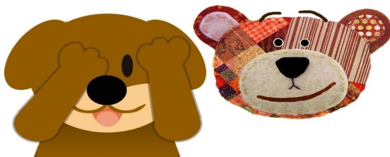
IMAGEM DISPONÍVEL EM https://i.ytimg.com/vi/YEtXkm1KB-o/mqdefault.jpg Acesso 24/06/2021

https://www.youtube.com/watch?v=YEtXkm1KB-o