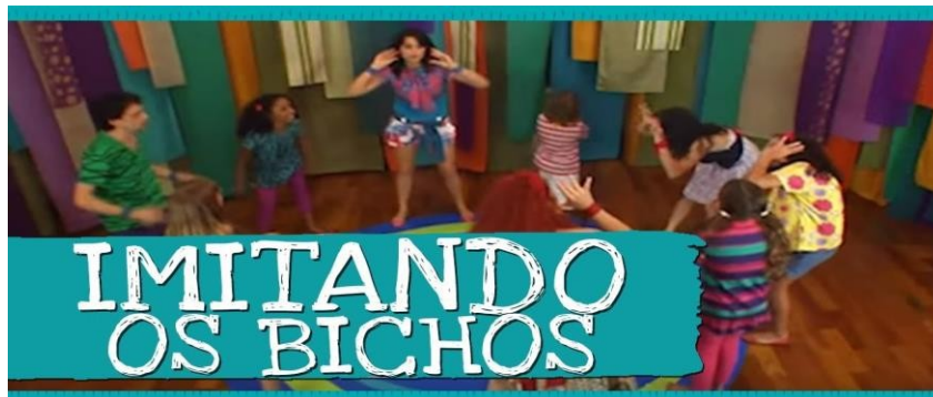
IMAGEM DISPONÍVEL EM https://i.ytimg.com/vi/slShEL-N1mA/maxresdefault.jpg ACESSO 24/06/2021

https://www.youtube.com/watch?v=slShEL-N1mA