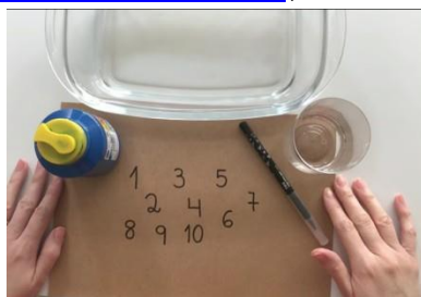
IMAGEM DISPONÍVEL EM: https://youtu.be/Ov-kvTslrs0 (ACESSADO EM: 07/07/2021).

https://youtu.be/Ov-kvTslrs0 (ACESSADO EM 07/07/21)