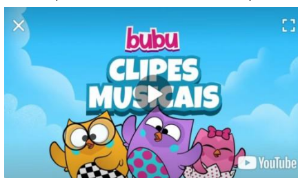
IMAGEM DISPONÍVEL EM: https://youtu.be/dh_Rh5IUfCo (ACESSADO EM 07/07/21)