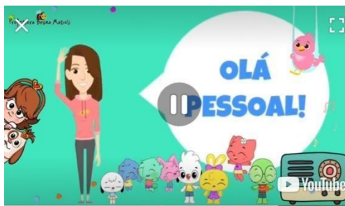
IMAGEM DISPONÍVEL EM: https://youtu.be/y2b3PqjZ4Wl