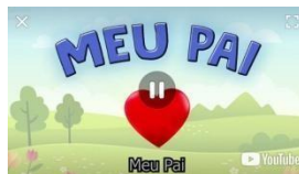
IMAGEM DISPONÍVEL EM: https://youtu.be/qixlSubCR3k ACESSO EM: 07/07/2021.