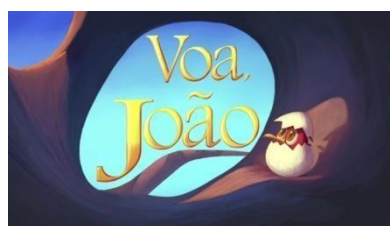
IMAGEM DISPONÍVEL EM: https://youtu.be/WsX9uOKlnc ACESSO EM: 07/07/2021.

CASO TENHA ACESSO A INTERNET, VOCÊ PODE VER E OUVIR A HISTÓRIA PELO LINK: https://youtu.be/WsX9uOKlnc (ACESSADO EM 07/07/21)