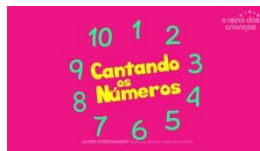
IMAGEM DISPONÍVEL EM: https://youtu.be/O6uhssemxeg ACESSO EM: 07/07/2021.