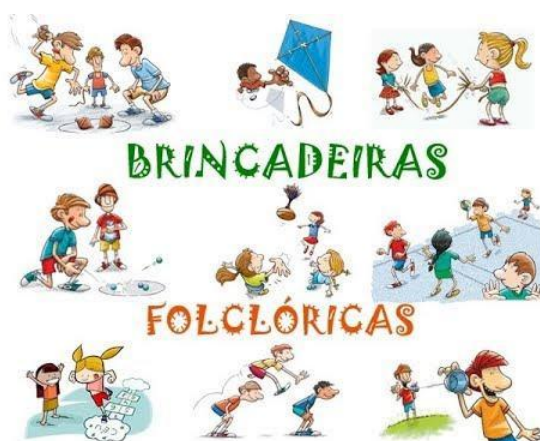
IMAGEM DISPONÍVEL EM: https://i.ytimg.com/vi/Nv-ZXzaH6_k/hqdefault.jpg