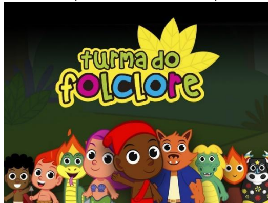
IMAGEM DISPONÍVEL EM: https://images-na.ssl-images-amazon.com/