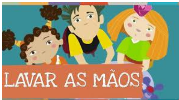
Imagem acessada em 01/08/2021 e disponibilizada no link:

https://www.youtube.com/watch?v=CaTXgmHyMSk