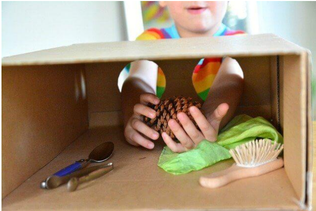
Imagem acessada em 01/08/2021 e disponibilizada no link:

https://www.dentrodahistoria.com.br/blog/educacao/como-fazer-caixa-sensorial/