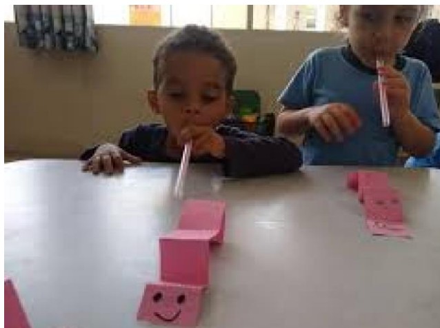
Imagem acessada em 17/06/2021 e disponibilizada no link

VOCÊ PRECISARÁ DE PAPEL A4, CANETA OU LÁPIS, COLA E RÉGUA OU TESOURA.