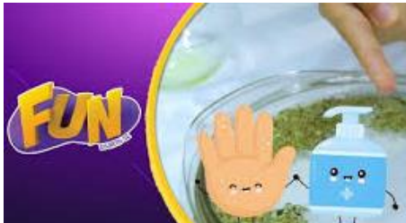
Imagem acessada em 01/08/2021 e disponibilizada no link: https://www.youtube.com/watch?v=7uNzaUxGFAC

VAMOS ASSISTIR COM ATENÇÃO AO VÍDEO COMO SE PREVENIR DO CORONAVÍRUS NO LINK: