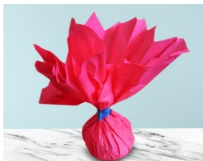
IMAGEM DISPONÍVEL EM: https://gobuddies.com/inspirac%CC%A7a%CC%83o-peteca-de-papel/ . ACESSADO EM 11/08/2021

A CRIANÇA PODERÁ COMEÇAR AMAÇANDO OS PAPEIS DE REVISTA (FAZENDO BOLINHAS). AMASSE UM PAPEL E EMBRULHE A BOLINHA EM OUTRO PAPEL ATÉ FORMAR UMA BOLA GRANDE. SE QUISER DEIXAR A PETECA MAIOR, AMASSE MAIS FOLHAS. ENVOLVA A BOLINHA COM FITA ADESIVA. EM SEGUIDA, COLOQUE A BOLA NO CENTRO DO PAPEL DE PRESENTE OU DA SACOLA PLÁSTICA, EMBRULHE E DEPOIS AMARRE COM O BARBANTE. ESTÁ PRONTINHA A PETECA! BOA DIVERSÃO!