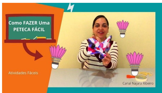
IMAGEM DISPONÍVEL EM: https://www.youtube.com/watch?v=qnztPyUMPhc . ACESSADO EM 11/08/2021

https://www.youtube.com/watch?v=qnztPyUMPhc