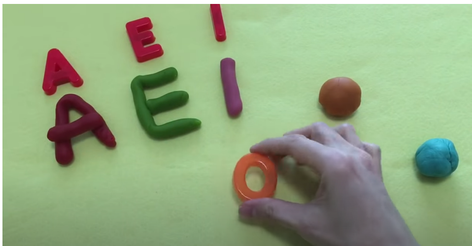
IMAGEM DISPONÍVEL EM: https://www.youtube.com/watch?v=3aHzJxCY0Is . ACESSO EM 11/08/2021

https://www.youtube.com/watch?v=3aHzJxCY0Is