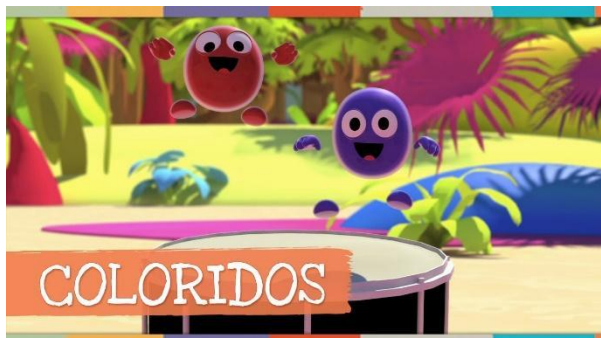
IMAGEM DISPONÍVEL EM: https://www.youtube.com/watch?v=x8VNNyobJRo . ACESSADO EM 11/08/2021

https://www.youtube.com/watch?v=x8VNNyobJRo