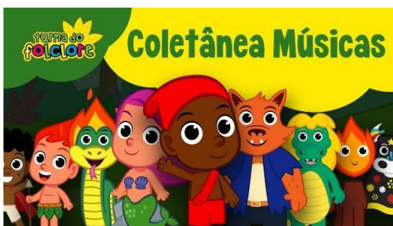
IMAGEM DISPONÍVEL EM: https://www.youtube.com/watch?v=jYufWk-PMLo . ACESSO EM 11/08/2021

https://www.youtube.com/watch?v=jYufWk-PMLo