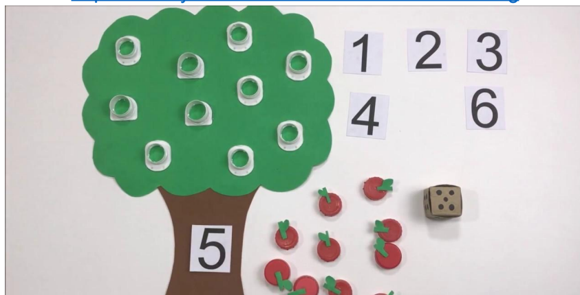
IMAGEM DISPONÍVEL EM https://www.youtube.com/watch?v=a5skWnnkASg . ACESSO EM 11/08/2021.

https://www.youtube.com/watch?v=a5skWnnkASg