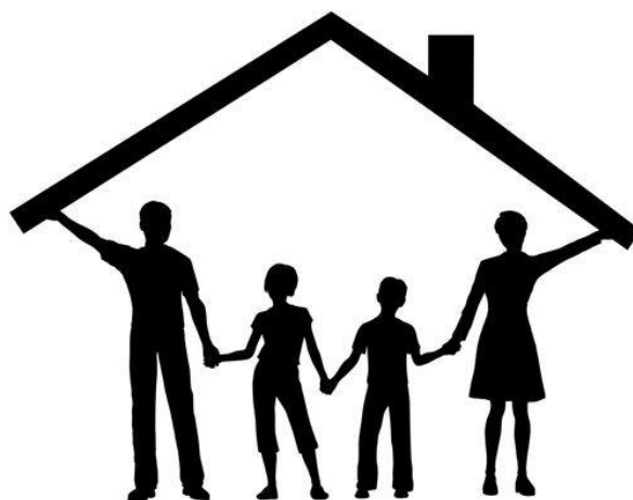
Imagem disponibilizada e acessada em 15/04/2021.

http://historiasylvio.blogspot.com/2015/05/familias.html