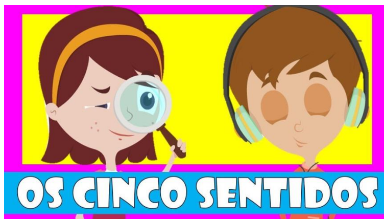
Imagem acessada em 07/04/2021 e disponibilizada no link

ACESSE O LINK ABAIXO ASSISTA, ESCUTE E CANTE A CANÇAS DOS CINCO SENTIDOS.