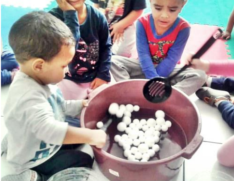
IMAGEM DISPONIBILIZADA E ACESSADA EM 07/04/2021

ATIVIDADE: PESCARIA COM ESPUMADEIRA, COLHER, CONCHA OU PENEIRA.