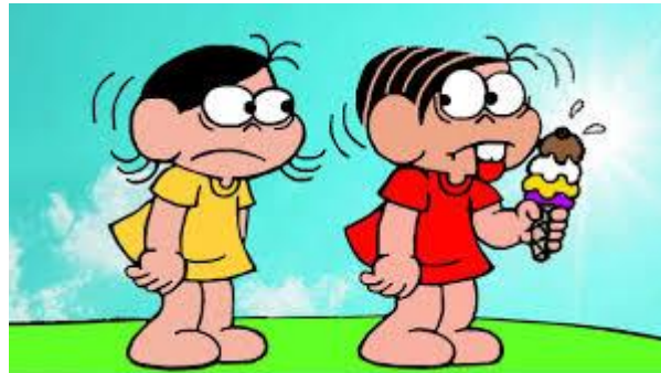
Imagem acessada em 06/04/2021 e disponibilizada no link

VAMOS CONHECER OS 5 SENTIDOS! ASSISTA A HISTORINHA DA TURMA DA MÔNICA! NO LINK ABAIXO: