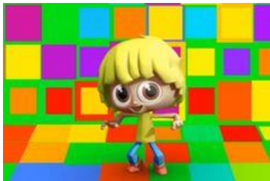
Imagem disponibilizada e acessada em 07/04/2021. https://www.youtube.com/watch?v=8e3MBmvAv0k

Para realizar essa atividade utilizaremos os seguintes materiais: