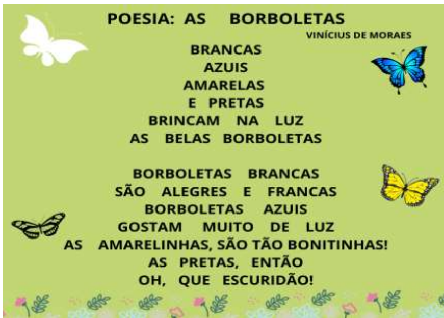
IMAGEM DO POEMA AS BORBOLETAS DE VINICIUS DE MORAES.

PARA HOJE VOU PEDIR PARA UM ADULTO LER COM A CRIANÇA O POEMA APONTANDO AS CORES DA BORBOLETA. APÓS A LEITURA AJUDE A CRIANÇA FAZER BOLINHAS DE PAPEL PARA COLAR NA BORBOLETA (A BOLINHA PODE SER FEITA COM PAPEL CREPON OU SE FOR O CASO PINTE UMA FOLHA COM LAPIS AMARELO E PIQUE PARA QUE A CRIANÇA POSSA COLAR NA BORBOLETA), FALE COM A CRIANÇA QUE A BORBOLETA QUE IRÃO PRODUIZIR É AMARELA.