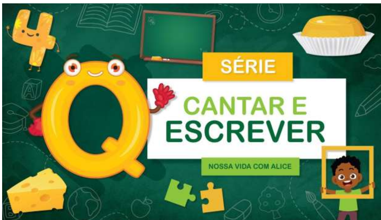
IMAGEM RETIRADA DO CANAL DO YOUTUBE: NOSSA VIDA COM ALICE ACESSO EM: 24/10/2021

MOSTRAR O QUE TEM NA SUA CASA COM A LETRA Q OU DESENHAR OBJETOS E ALIMENTOS QUE COMECEM COM A LETRA Q. ESCREVA O NOME DE PELO MENOS 3 COISAS QUE COMECEM COM ESSA LETRA.