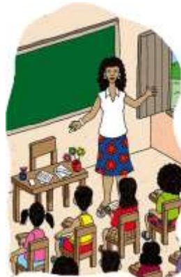
B) PRESENCIAL NA ESCOLA