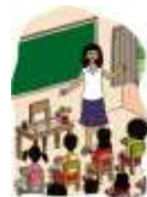
C) ON-LINE E PRESENCIAL JUNTO

3) MOSTRE AS ATITUDES NECESSÁRIAS QUE TEMOS QUE TER QUANDO RETORMARMOS AO PRESENCIAL E QUE VOCÊ JÁ PRÁTICA EM CASA: