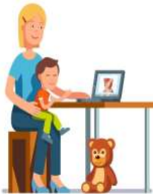
A) ON-LINE EM CASA

2) QUAL O TIPO DE AULA VOCÊ PREFERE? INDIQUE.