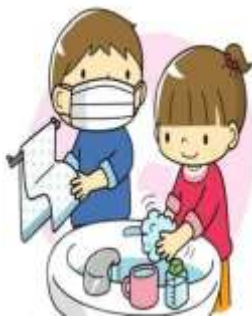
A) LAVAR AS MÃOS COM ÀGUA, SABÃO E ÁLCOOL EM GEL

3) MOSTRE AS ATITUDES NECESSÁRIAS QUE TEMOS QUE TER QUANDO RETORMARMOS AO PRESENCIAL E QUE VOCÊ JÁ PRÁTICA EM CASA: