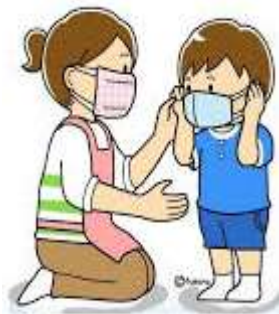
B) USAR MÁSCARA