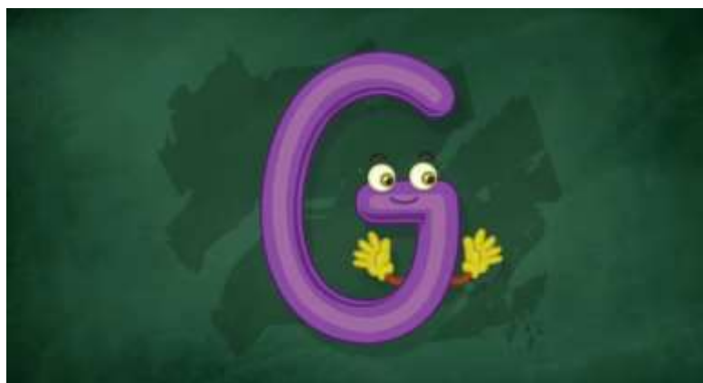
IMAGEM RETIRADA DO CANAL DO YOUTUBE NOSSA VIDA COM ALICE

ACESSE O LINK: https://www.youtube.com/watch?v=rG3wd-P0Qfc&t=56s ACESSO 01/07