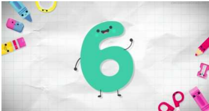
IMAGEM RETIRADA DO CANAL DO YOUTUBE NOSSA VIDA COM ALICE

EM UMA FOLHA FAÇA O NÚMERO 6 BEM GRANDE E DECORE COM MATERIAIS QUE VOCÊ TEM EM CASA, DESENHE OU COLE 6 FIGURAS AO LADO DO NÚMERO 6 PARA RELACIONAR QUANTIDADE.