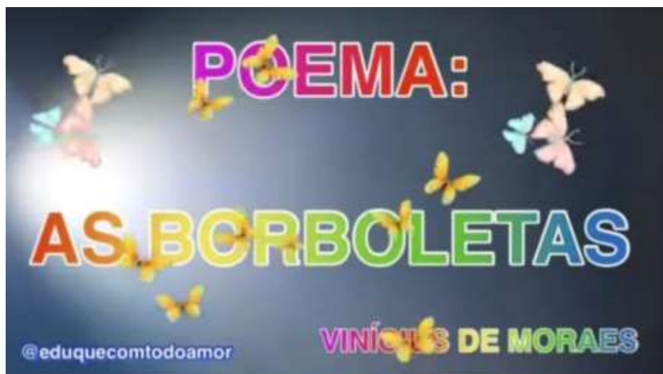
IMAGEM RETIRADA DO CANAL DO YOUTUBE EDUQUE COM TODO AMOR

AGORA FAÇA UM DESENHO REPRESENTANDO A POESIA. TIRE UMA FOTO.