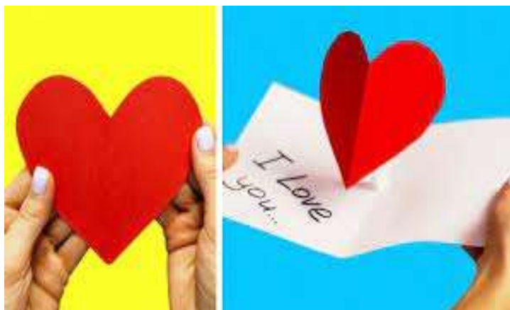
IMAGEM RETIRADA DO CANAL IDEIAS INCRÍVEIS

PARA ESTA ATIVIDADE VOCÊ PODERÁ ESCOLHER OS MATERIAIS QUE TÊM EM CASA E CONFECCIONAR UM CARTÃO BEM BONITO E CRIATIVO PARA HOMENAGEAR QUEM CUIDA DE VOCÊ.