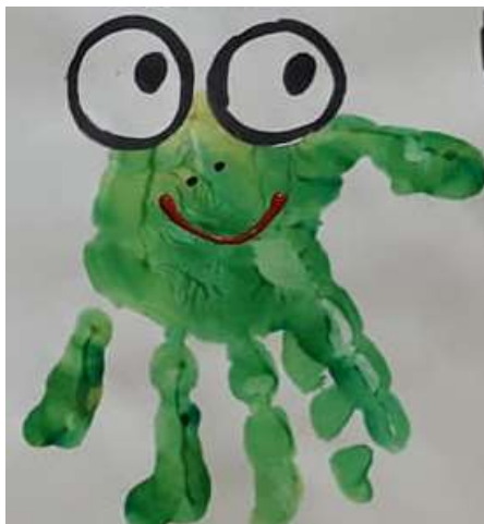
IMAGEM RETIRADA DO CANAL PROFESSORA IVANI FERREIRA

AGORA UTILIZANDO SUA MÃO FAÇA O DESENHO DE UM SAPO BEM DIVERTIDO, COLORE, TIRE UMA FOTO E ENVIE PARA A PROFESSORA.