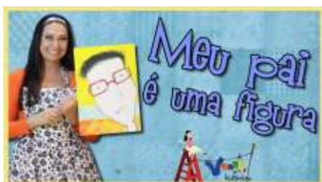
IMAGEM RETIRADA DO CANAL VARAL DE HISTÓRIAS

ACESSE O LINK: https://youtu.be/fDS1BPd-qfl ACESSO EM 28/07