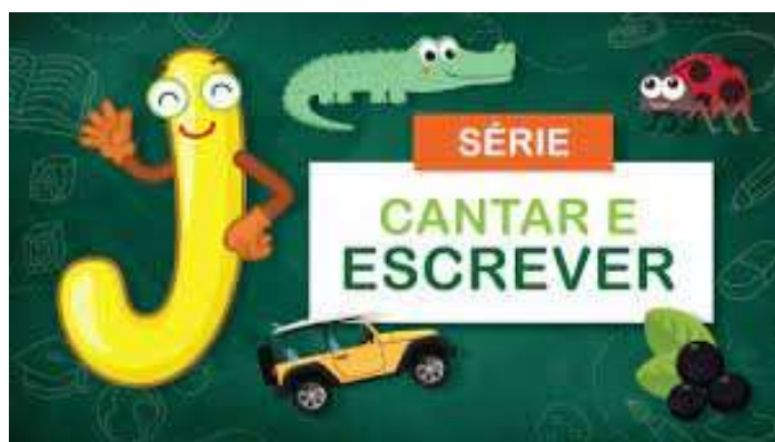
IMAGEM RETIRADA DO CANAL NOSSA VIDA COM ALICE

AGORA ESCREVA TRÊS PALAVRAS INICIADAS COM A LETRA J .