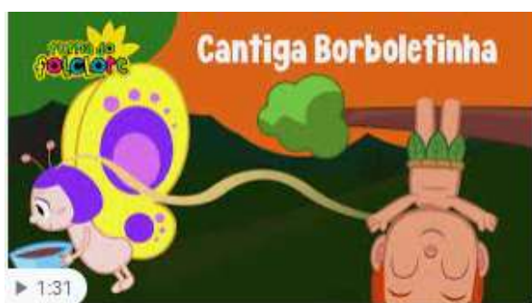
Música Borboletinha - Turma do Folclore - YouTube

CLIQUE NO LINK: https://youtu.be/hNciCXdgwt4