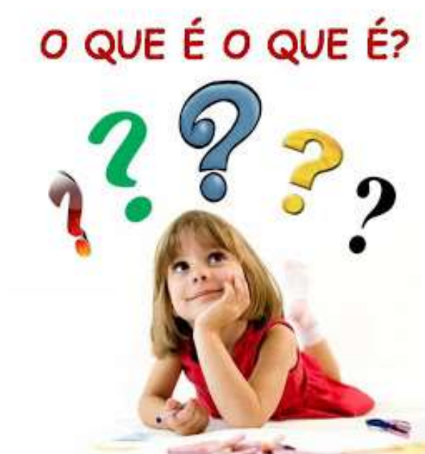
IMAGEM RETIRADA DO CANAL DO SITE FERNAOGAIVOTA.COM.BR

ACESSE AO LINK: https://www.youtube.com/watch?v=DbTPfu6HQao ACESSO 12/08