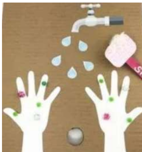
IMAGEM RETIRADA DO SITE

IMAGEM RETIRADA DO CANAL BELINHA, A OVELHINHA.