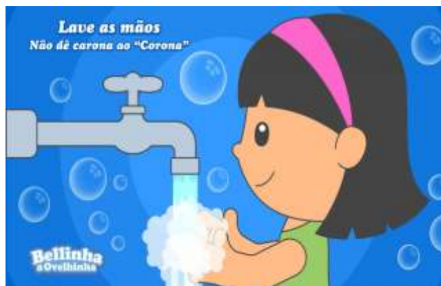
IMAGEM RETIRADA DO CANAL BELINHA, A OVELHINHA.

ACESSE O LINK: https://youtu.be/uqm0DuRHys ACESSO EM 28/08