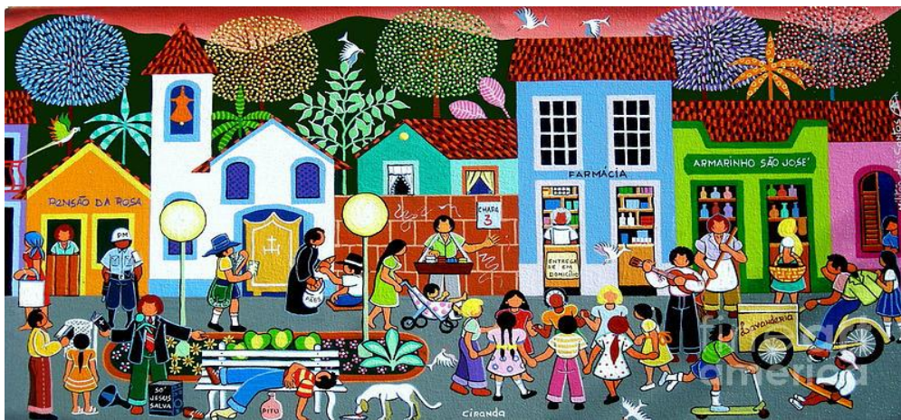
Imagem do site: https://www.artavita.com/artists/3553-militao-dos-santos

https://br.pinterest.com/pin/565272190710027653/