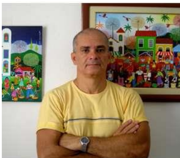
Imagem do site: https://www.guiadasartes.com.br/antonio-militao-dos-santos/obras-principais

Então juntos devem escolher uma das brincadeiras apresentadas nas obras e brincar.