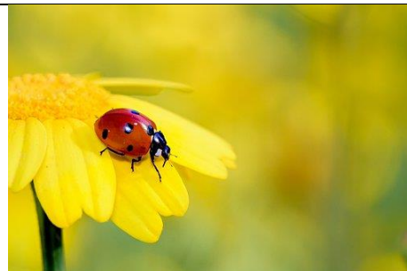
Mais de 50.000 imagens grátis de Insetos e Borboleta (pixabay.com)