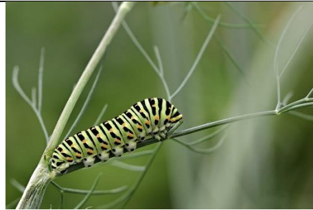
Lagarta Ensamblagem Inseto

- Vamos fazer um fantoche de joaninha seguindo o modelo com rolinho de papel higiênico, pode pintar ou colar papel preto, cortar um círculo colorido ao meio e pintar cinco bolinhas em cada lado da asa, pintar os olhos ou colar e colar as antenas.