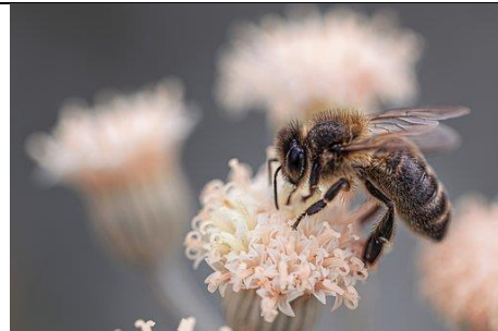
Macro Abelha Insetos