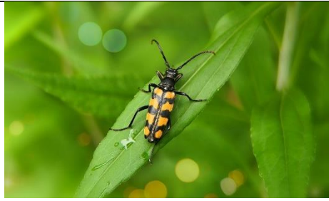
Inseto Besouro Longhorn Strangalia