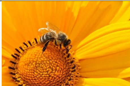
Abelha Inseto Flor De