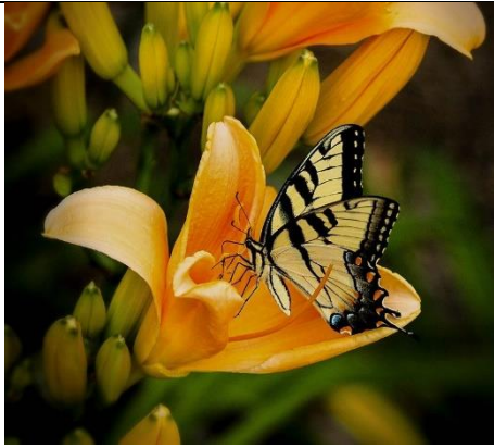
Borboleta Inseto Jardim Rabo De