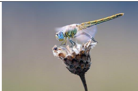
Libélula Inseto Macro - Foto gratuita no Pixabay