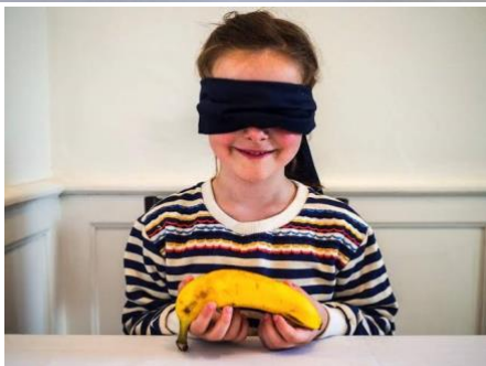
Imagem extraída da internet: