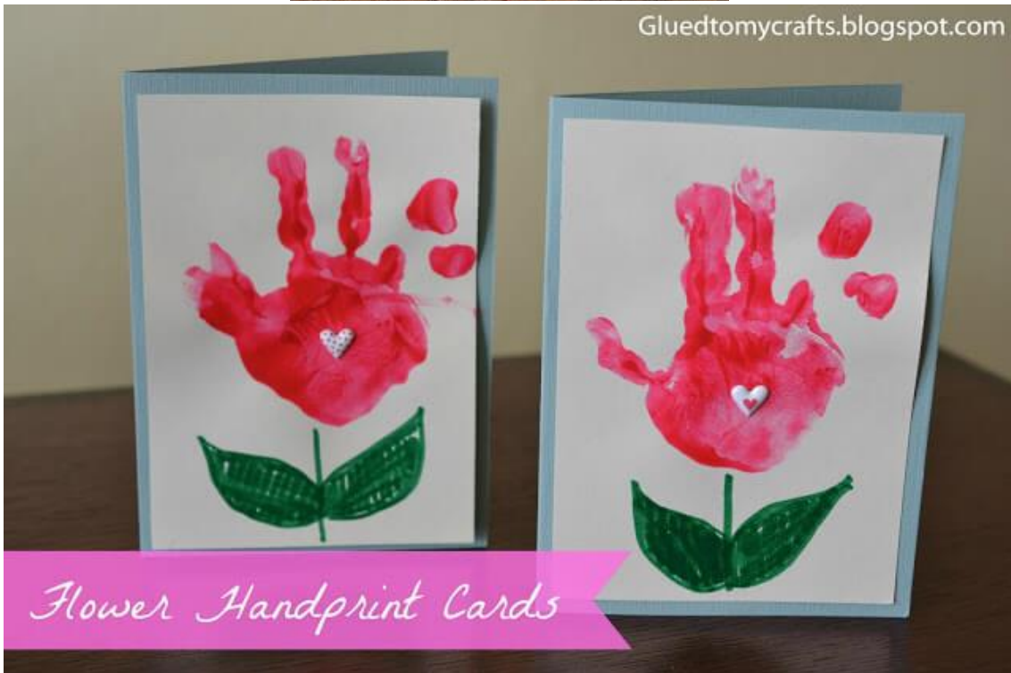
Flower Handprint Cards