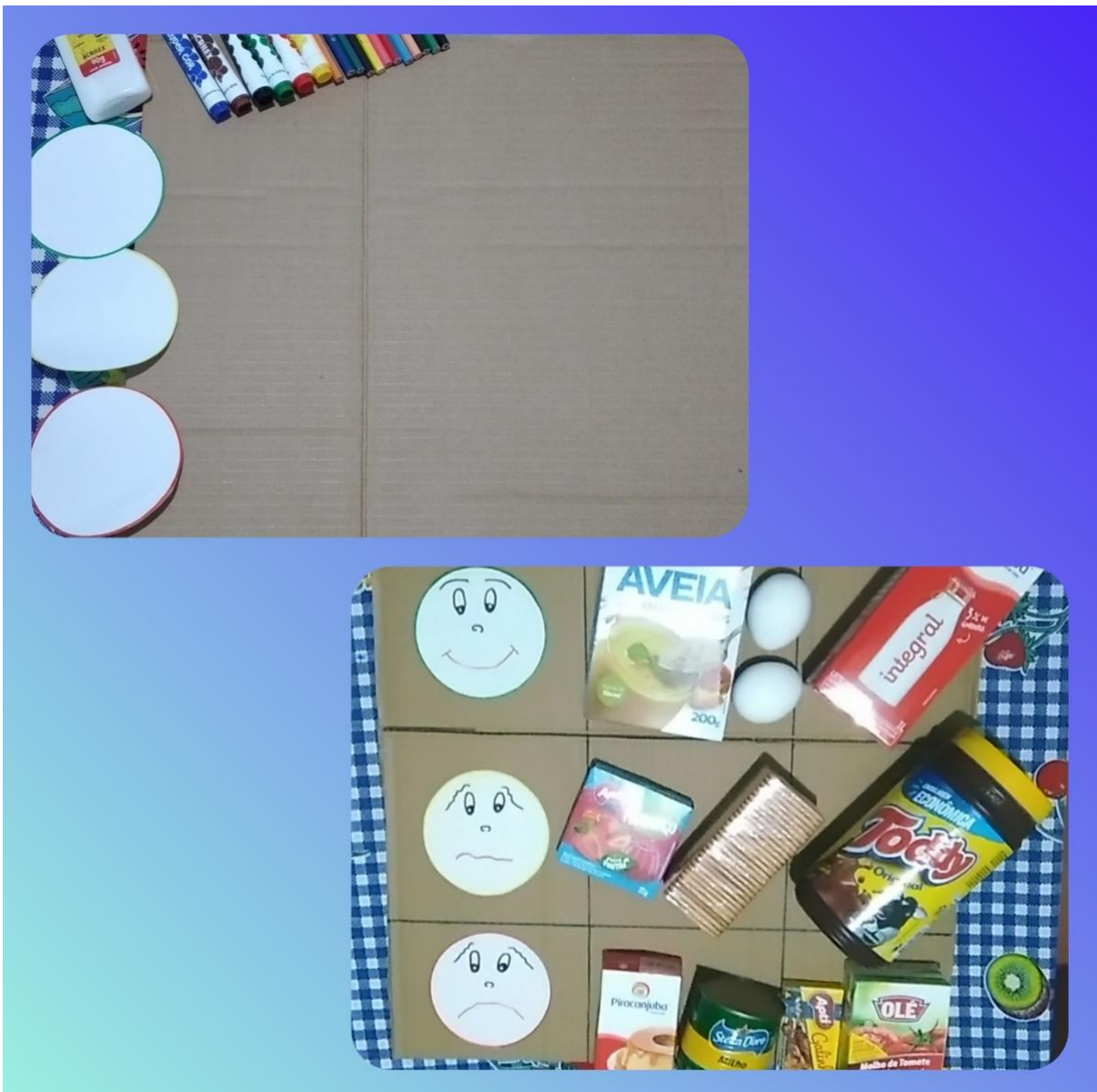
Exemplo da atividade