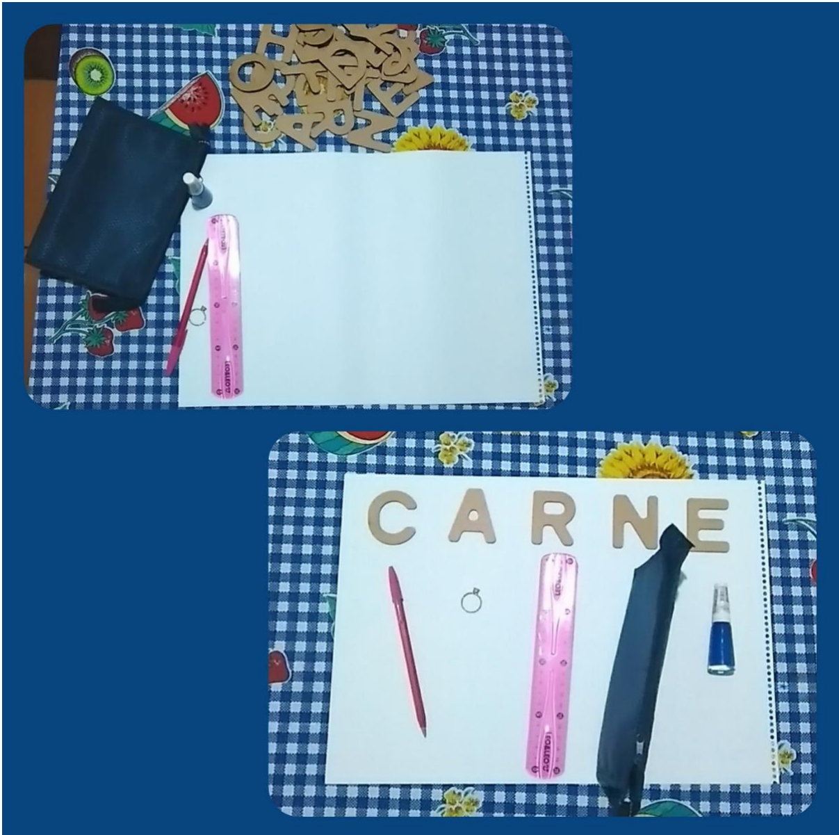
Exemplo da atividade proposta