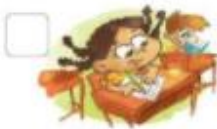
VIA A ESCOLA.