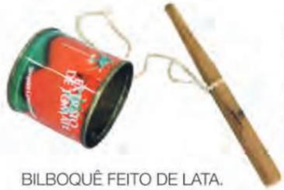
BILBOQUÊ FEITO DE LATA.

O BILBOQUÊ ERA CONSTRUÍDO COM UMA LATA VAZIA, UM PEDAÇO DE BARBANTE E UM BASTÃO DE MADEIRA. PARA BRINCAR, ERA PRECISO JOGAR A LATA PARA O ALTO E, AO CAIR, ENCAIXÁ-LA NO BASTÃO.