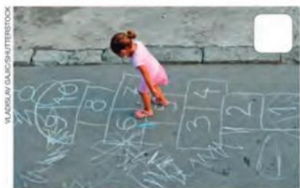
BRINCAR DE AMARELINHA.