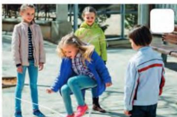
BRINCAR DE PULAR ELÁSTICO.