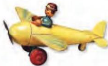
AVIÃO DE BRINQUEDO DE MADEIRA.