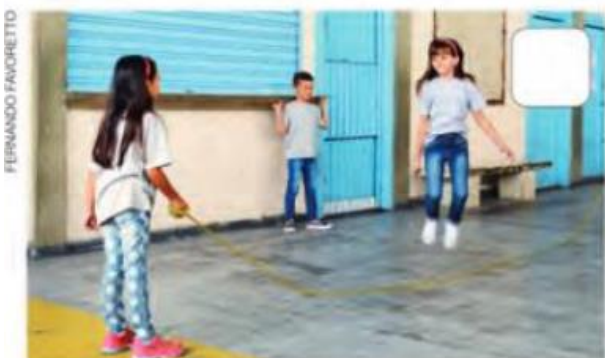
BRINCAR DE PULAR CORDA.