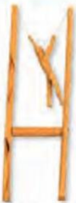
TRAPEZISTA DE MADEIRA.