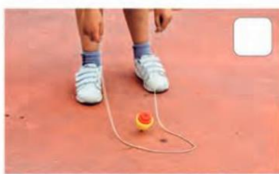
BRINCAR DE JOGAR PIÃO.