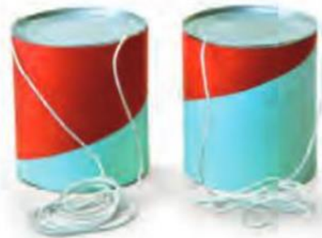
PÉS DE LATAS.

OS PÉS DE LATAS TAMBÉM PODIAM SER FEITOS COM LATAS USADAS E BARBANTE. DEPOIS DE PRENDER O BARBANTE NAS LATAS PASSANDO PELOS FUROS, ERA SÓ SUBIR NELAS E SAIR ANDANDO.