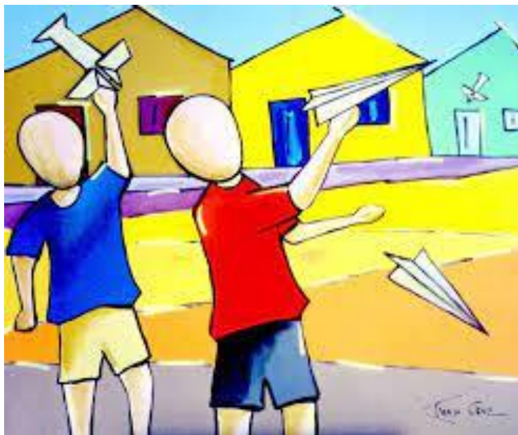
Aviãozinho de papel