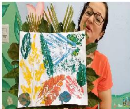
Imagem disponível em: https://www.youtube.com/watch?v=Dnnx2es9ofc Acesso:05/10/21

*Fazer o registro da atividade por meio de foto ou vídeo e enviar para a Professora.