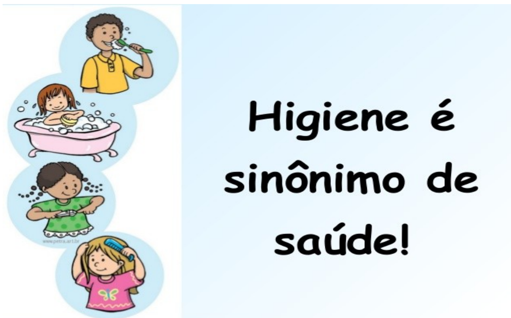
Imagem disponível em:

https://image.slidesharecdn.com/higieneesaude-101126120145-phpapp02/95/higiene-e-saude-1-638.jpg?cb=1422657852