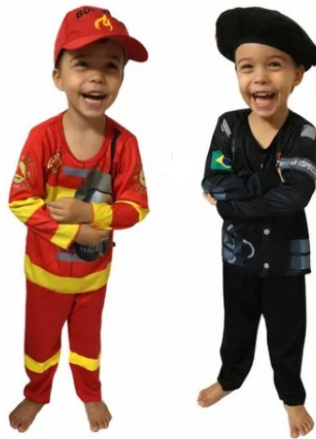
Imagem disponível em:

a) Depois de assistir o vídeo, disponibilize adereços para que a criança possa representar a sua profissão preferida.