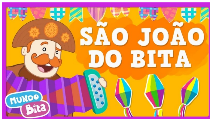
Imagem disponível em: https://www.youtube.com/watch?v=ueTMLzcYcu0 , acesso em 13/05/2021.

https://www.youtube.com/watch?v=ueTMLzcYcu0