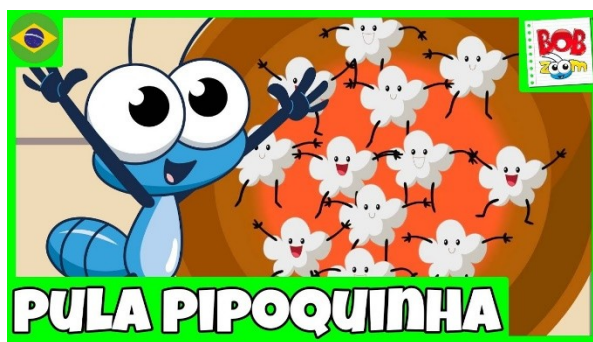
Imagem disponível em https://www.youtube.com/watch?v=MgG13r2fVOw acesso em 17/05/21.

https://www.youtube.com/watch?v=MgG13r2fVOw