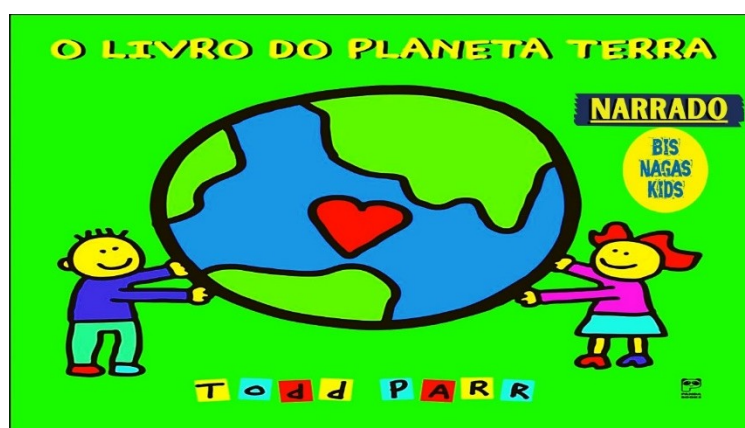
Imagem disponível em : https://www.youtube.com/watch?v=IYv4ZntglxA . acesso em 17/05/21.

https://www.youtube.com/watch?v=IYv4ZntglxA