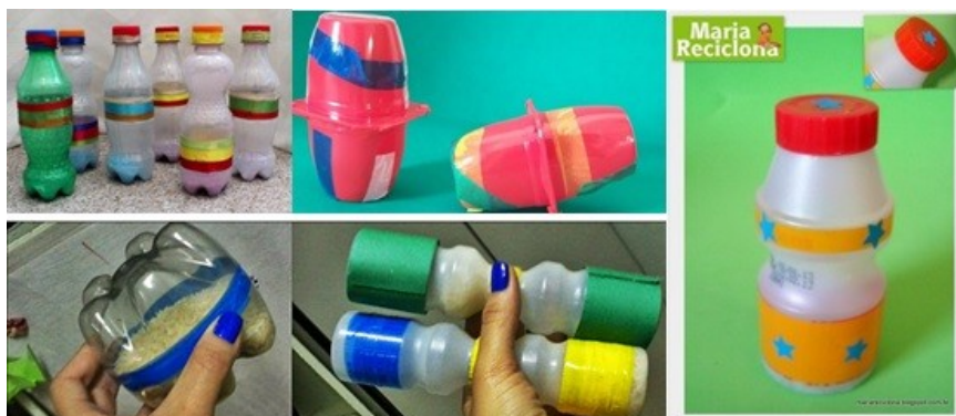
Imagem disponível em https://educacaodigital.itaborai.rj.gov.br/lms/mod/assign/view.php?id=29162&forceview=1 acesso em 17/05/21.

b) Com a ajuda de um familiar, escolha um instrumento musical que viu no vídeo e vamos fazer igual?