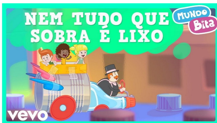
Imagem disponível em : https://www.youtube.com/watch?v=rUeaT5eqCyg Acesso em 20/05/21.

https://www.youtube.com/watch?v=rUeaT5eqCyg