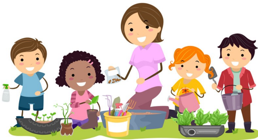
Imagem disponível em: https://escolakids.uol.com.br/datas-comemorativas/dia-do-meio-ambiente.htm acesso em 07/05/2021.

A educação Ambiental não deve ser tratada como algo distante do cotidiano dos alunos, mas como parte de suas vidas. É de suma importância a conscientização da preservação do Meio Ambiente para a nossa vida e todos os seres vivos, afinal vivemos nele e precisamos que todos os seus recursos naturais sejam sempre puros. A conscientização quanto a essa preservação deve iniciar cedo, pois é muito mais fácil fazer as crianças entenderem a importância da natureza e quando esse ensinamento inicia logo, elas com certeza, irão crescer com essa ideia bem formada.