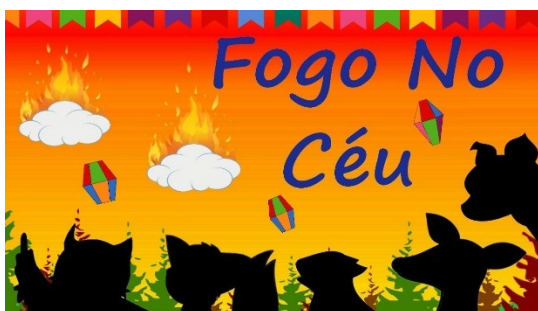
Imagem disponível em https://www.youtube.com/watch?v=fY7qwopDbkM&t=38s acesso em 17/05/21.

a) Hora da história: https://www.youtube.com/watch?v=fY7qwopDbkM&t=38s