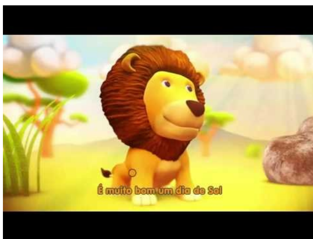
Imagem disponível em : https://www.youtube.com/watch?v=B8HC45BcVqI acesso em 31/05/2021.

https://www.youtube.com/watch?v=B8HC45BcVqI