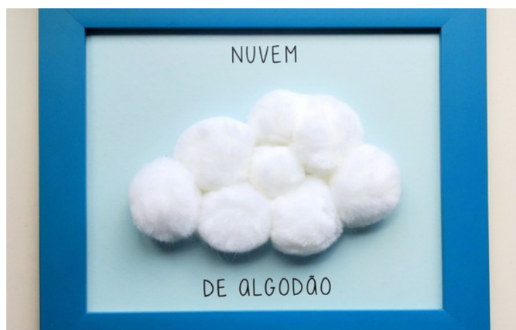
Imagem disponível em: https://www.elo7.com.br/quadro-sensorial-infantil-nuvem-de-algodao/dp/1214DA5 acesso em 02/06/21.

* Fazer o registro da atividade por meio de foto ou vídeo e enviar para a professora