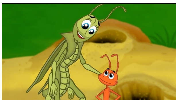
Imagem disponível em: https://www.youtube.com/watch?v=vzNZoDivqG4 acesso em 02/06/21.

https://www.youtube.com/watch?v=vzNZoDivqG4