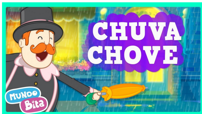
Imagem disponível em : https://www.youtube.com/watch?v=cM1Q0Riguew acesso em 31/05/21.

https://www.youtube.com/watch?v=cM1Q0Riguew