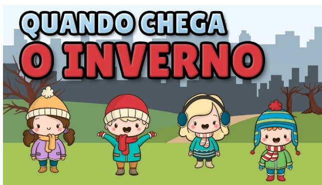
Imagem disponível em: https://www.youtube.com/watch?v=ByaOihDuIDE Acesso em 11/06/21.

https://www.youtube.com/watch?v=ByaOihDuIDE