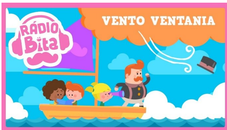
Imagem disponível em : https://www.youtube.com/watch?v=ZHKRxjwKnXM acesso em 31/05/21.

https://www.youtube.com/watch?v=ZHKRxjwKnXM