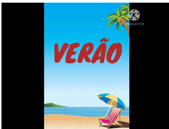
Imagem disponível em: https://www.youtube.com/watch?v=o0lIMvnqRIs Acesso em 11/06/21

https://www.youtube.com/watch?v=o0lIMvnqRIs