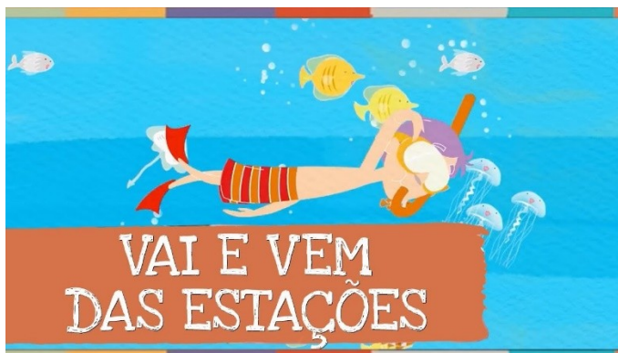
Imagem disponível em: https://www.youtube.com/watch?v=jlNoF8GEGWc&t=188s acesso em 11/06/21

https://www.youtube.com/watch?v=jlNoF8GEGWc&t=188s