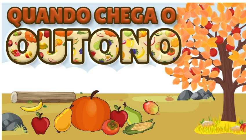
Imagem disponível em: https://www.youtube.com/watch?v=HDx2AU-4d3Y Acesso em 11/06/21.

https://www.youtube.com/watch?v=HDx2AU-4d3Y