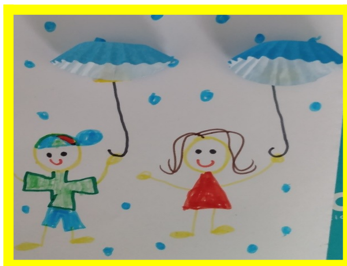
imagem disponível em https://images.app.goo.gl/kvVn2LWnkiopWqrZ6 - Acesso em 08/07/2021

Para representar esse elemento tão importante para a vida, vamos criar um desenho com guarda-chuvas feitos com forminhas de doces conforme o exemplo abaixo: