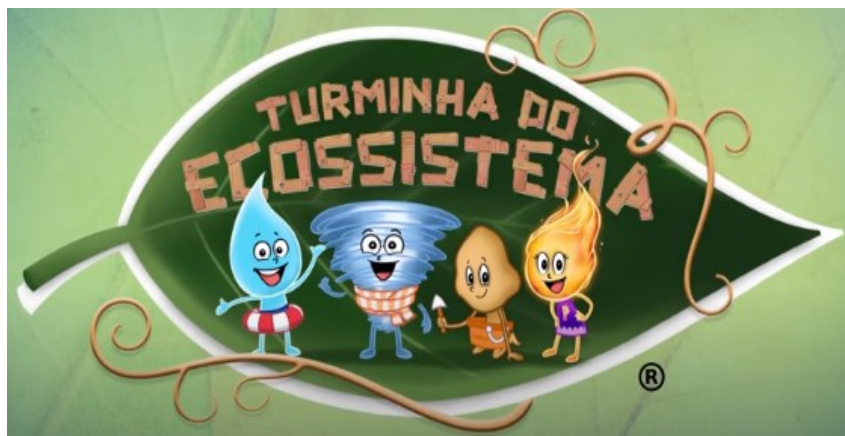
Imagem disponível em: https://youtu.be/HgR3absru0g Acesso em 10/06/2021.