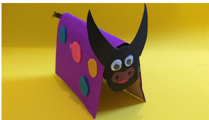
Imagem disponível em; https://www.youtube.com/watch?v=gJnb1bl9APA Acesso em 24/07/21.

https://www.youtube.com/watch?v=gJnb1bl9APA