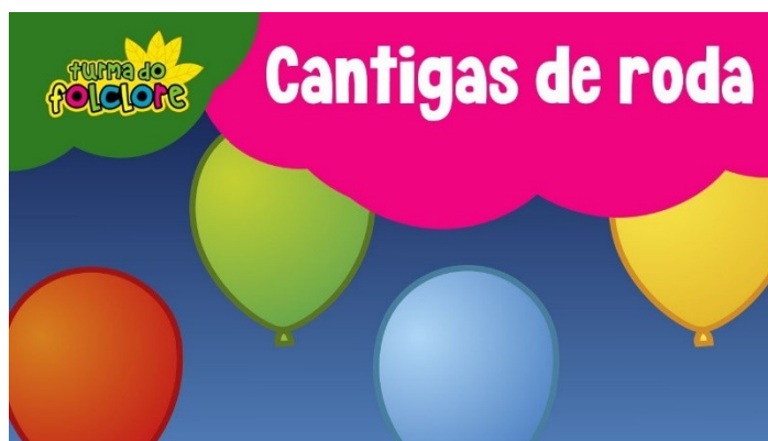
Imagem disponível em https://www.youtube.com/watch?v=jYufWk-PMLo Acesso em 24/07/21.

https://www.youtube.com/watch?v=jYufWk-PMLo