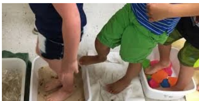
Imagem disponível em:

https://escolaeducacao.com.br/projeto-cinco-sentidos-na-educacao-infantil/projeto-cinco-sentidos-educacao-infantil-5/ Acesso em 24/07/21.