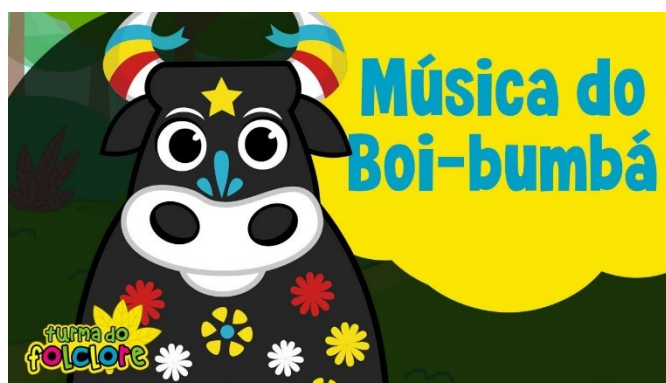
Imagem disponível em; https://www.youtube.com/watch?v=YP3Zil-dpLs acesso em 24/07/21.

https://www.youtube.com/watch?v=YP3Zil-dpLs