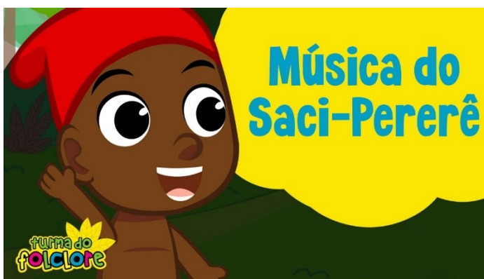
Imagem disponível em: https://www.youtube.com/watch?v=ljTSqTkaseA Acesso em 24/07/21.

https://www.youtube.com/watch?v=ljTSqTkaseA