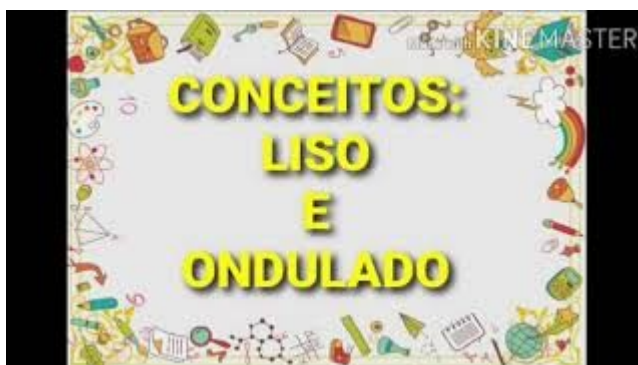
Imagem disponível em https://www.youtube.com/watch?v=4hCJEKkfbfo Acesso em 23/07/21

https://www.youtube.com/watch?v=4hCJEKkfbfo