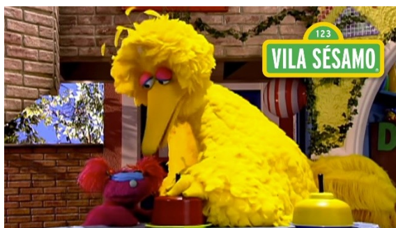
Imagem disponível em : https://www.youtube.com/watch?v=IWKYs0U7nCs Acesso em 24/07/21.

https://www.youtube.com/watch?v=IWKYs0U7nCs