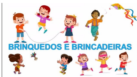
Imagem disponível em: https://www.youtube.com/watch?v=dVBxl7Sw_6k Acesso em 24/07/21.

https://www.youtube.com/watch?v=dVBxl7Sw_6k