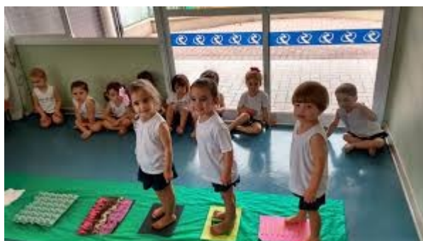
Imagem disponível em: http://www.domboscopira.com.br/colégio/post/pisando-num-tapete-sensorial Acesso em 24/07/21.

https://www.youtube.com/watch?v=q4PQet4XvuA