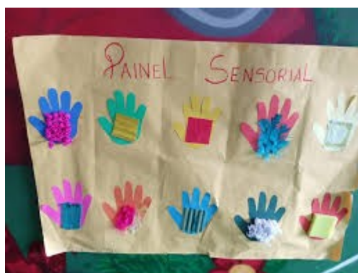
Imagem disponível em:

https://www.facebook.com/CrechAconchego/posts/-experimentando-texturas-a-turminha-da-creche-i-foi-apresentada-ao-nosso-mural-s/2035358546773077/