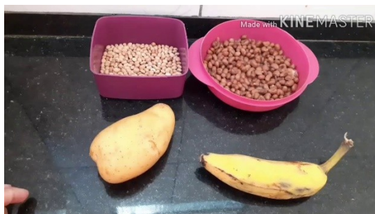
Imagem disponível em : https://www.youtube.com/watch?v=XglC57OPJEk Acesso em 24/07/21.

https://www.youtube.com/watch?v=XglC57OPJEk