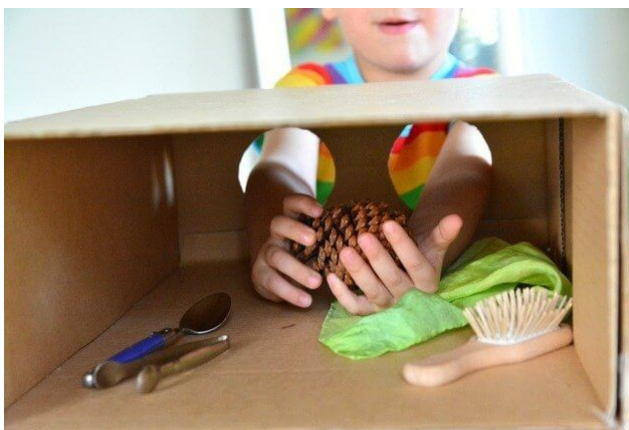
Imagem disponível em: https://www.dentrodahistoria.com.br/blog/educacao/como-fazer-caixa-sensorial/

https://www.youtube.com/watch?v=gzDsZD8kvow