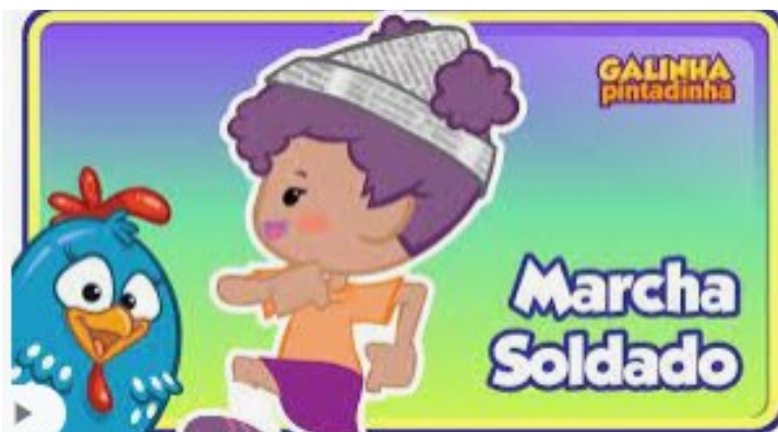
Imagem disponível em: https://youtu.be/8Dwr0wgrt0E Acesso em 05/08/2021.

a) Com ajuda de um adulto, a criança deverá ter acesso ao vídeo disponível no YouTube conforme link a seguir: https://youtu.be/8Dwr0wgrt0E