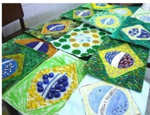
Imagem disponível em: https://images.app.goo.gl/cTZriCFqvC8y9sVXA . Acesso em 05/08/2021.

* FAZER O REGISTRO DA ATIVIDADE E ENVIAR PARA A PROFESSORA.