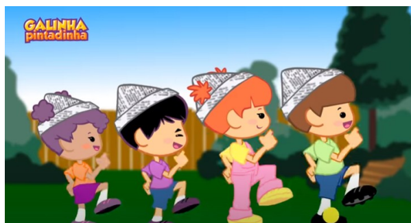
Imagem disponível em: https://www.youtube.com/watch?v=8Dwr0wgrt0E Acesso em 10/08/21.

https://www.youtube.com/watch?v=8Dwr0wgrt0E