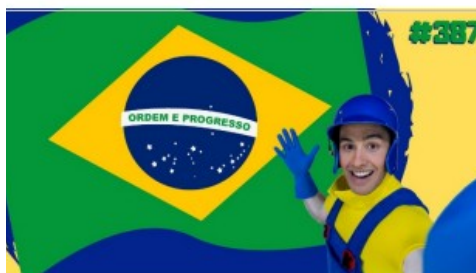
Imagem disponível em : https://www.youtube.com/watch?v=wxThsZKbmGg Acesso em 10/08/21.

https://www.youtube.com/watch?v=wxThsZKbmGg