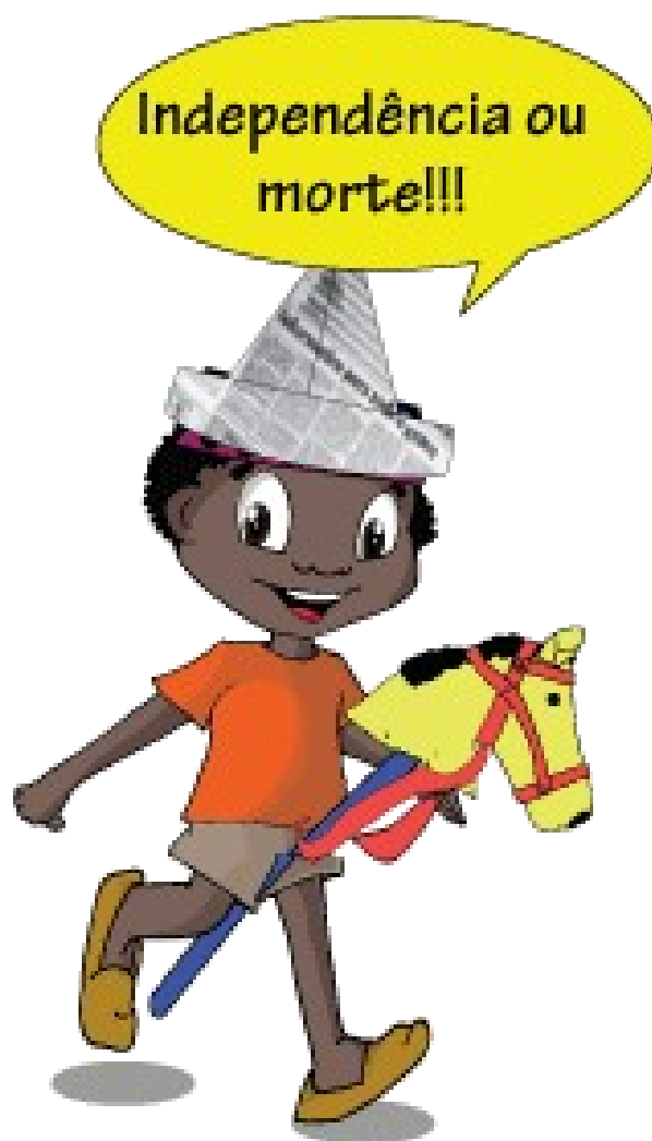
Imagem disponível em:

c) Quando estiver pronto a criança poderá brincar de soldadinho, marchando e se possível dizendo a frase de Dom Pedro I “Independência ou Morte”.