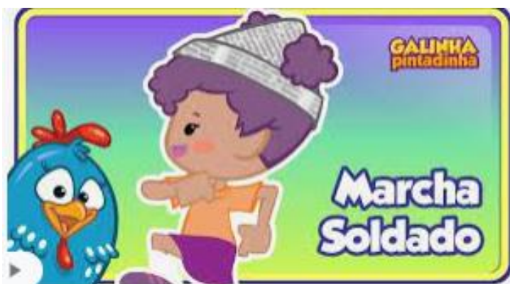
Imagem disponível em: https://youtu.be/8Dwr0wgrt0E Acesso em 05/08/2021.