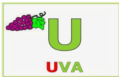
Imagem disponível em: https://br.pinterest.com/pin/529947081137905414/ acesso em 17/03/21.