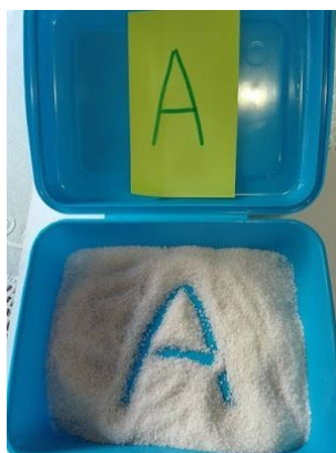
Imagem disponível em: https://br.pinterest.com/pin/829929037560450005/ Acesso em 08/02/2021

https://www.youtube.com/watch?v=8FSExZBg29A