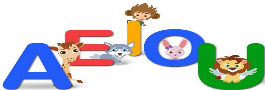
Imagem disponível em: https://www.youtube.com/watch?v=iVsQMyNacMw - Acesso em 16/03/2021.

A fase de desenvolvimento da criança, traz a necessidade da realização de um trabalho sistemático de apresentação das vogais, que partirá do todo para as partes. A criança como todo ser humano, é um sujeito social e histórico, faz parte de uma sociedade letrada que exige um aprendizado eficiente para que o mesmo possa se distinguir dos demais no meio em que convive.