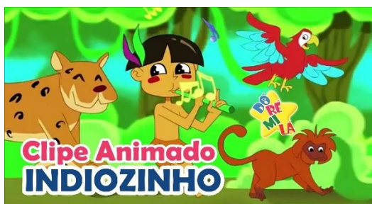
Imagem disponível em: https://www.youtube.com/watch?v=jJa7Y6UgH8E acesso em 18/03/21.