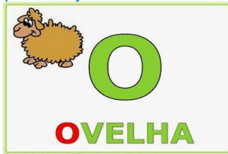
Imagem disponível em: https://br.pinterest.com/pin/529947081137905416/ acesso em 17/03/21.