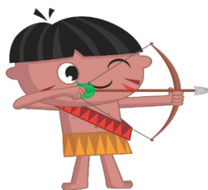
Imagem disponível em : https://br.pinterest.com/pin/363384263679634564/ acesso em 18/03/21.

https://www.youtube.com/watch?v=2v5n7Q8oK0Q