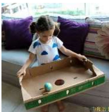
IMAGEM DISPONÍVEL EM:

A CRIANÇA SEGURA A TAMPA DE PAPELÃO COM AS DUAS MÃOS, COLOCA-SE A BOLINHA E ELA VAI FAZENDO MOVIMENTOS COM A TAMPA A FIM DE QUE A BOLINHA CAIA PELO BURACO (CHEGUE EM CASA).