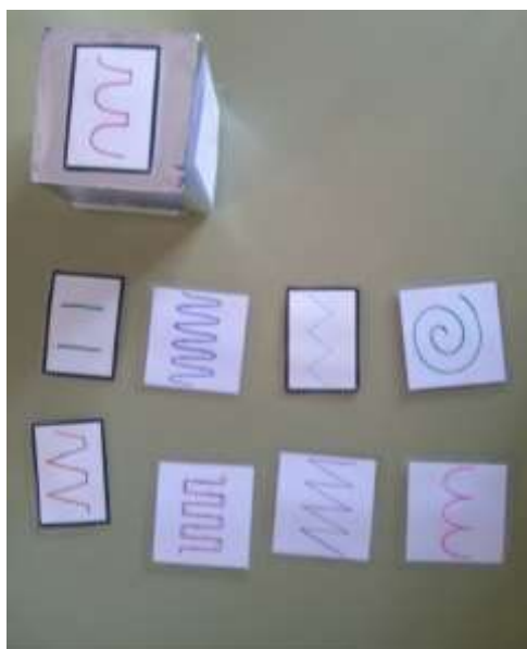
Fig.1, Fonte: https://mestreinfantil.blogspot.com

OBS: QUANDO TERMINAR OS TRAÇADOS E LETRAS DO NOME, PODE FAZER DESENHOS LIVRES.