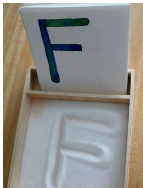
Fig. 2, Fonte: https://www.redepedagogica.com.br