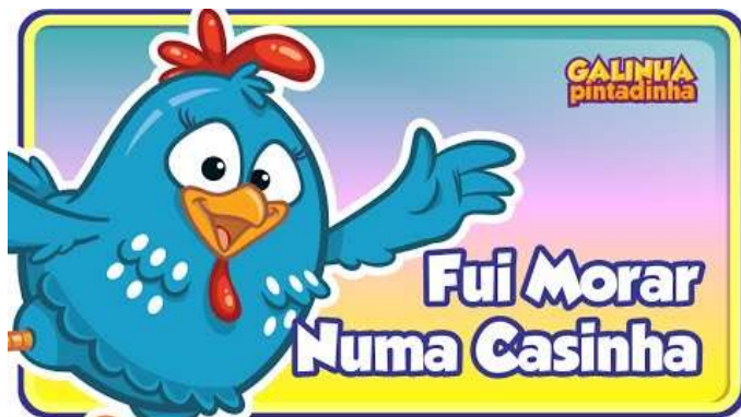
IMAGEM DISPONÍVEL EM: https://youtu.be/VJQaBK70f24 (ACESSO EM 19/07/2021)

MÚSICA/ CLIPE MUSICAL: FUI MORAR NUMA CASINHA (GALINHA PINTADINHA)