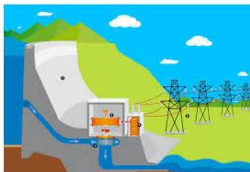
PRODUZIR ENERGIA ELÉTRICA