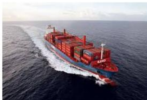
TRANSPORTAR MERCADORIAS E PESSOAS