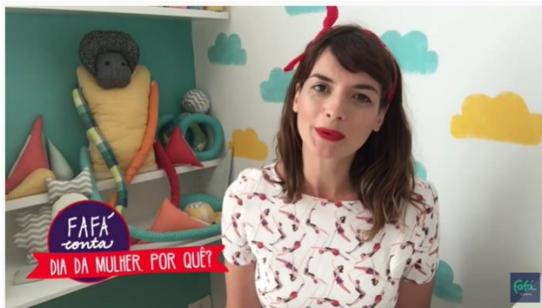
DIA DA MULHER. explicado para crianças - Fafá conta curiosidades