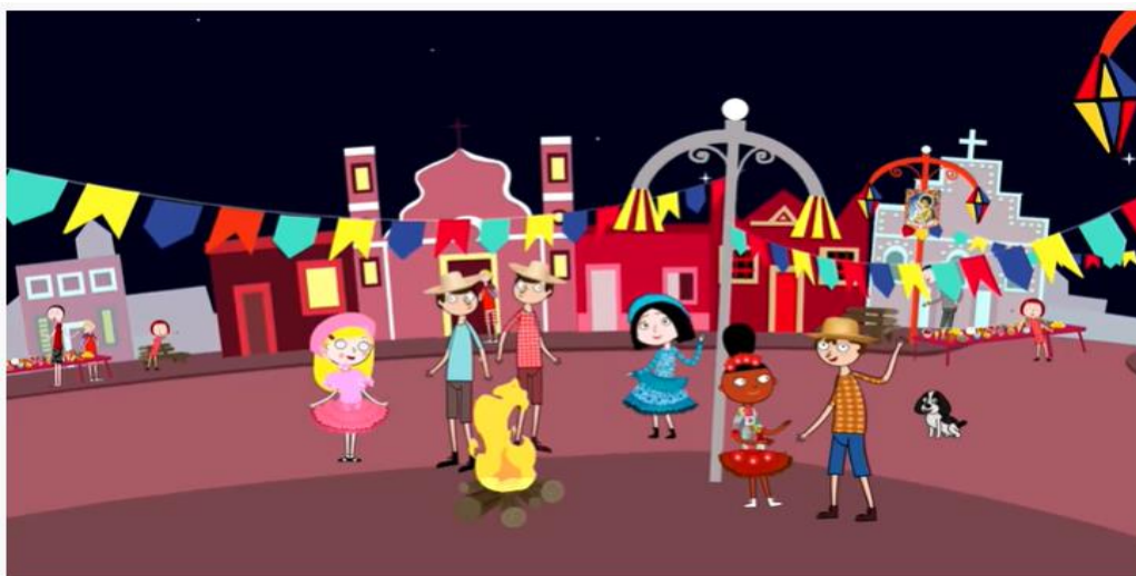
Charlotte na Festa Junina | Canal da Charlotte

https://www.youtube.com/watch?v=sMighLP7MZY&t=48s