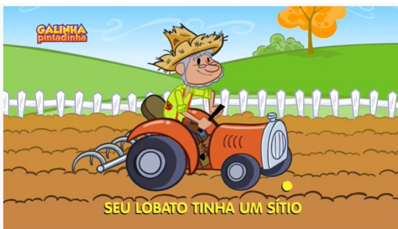
SEU LOBATO - Clipe Música Oficial - Galinha Pintadinha 4

https://www.youtube.com/watch?v=3r4cadv1Cmw