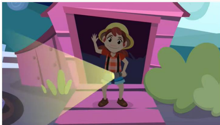
Os animais da fazenda para crianças - Vocabulário para crianças

VAMOS DESCOBRIR QUAIS SÃO OS ANIMAIS DA FAZENDA E O SOM QUE ELES FAZEM, DE UMA MANEIRA DIVERTIDA. CLICK NO LINK ABAIXO E ASSISTA AO VÍDEO: