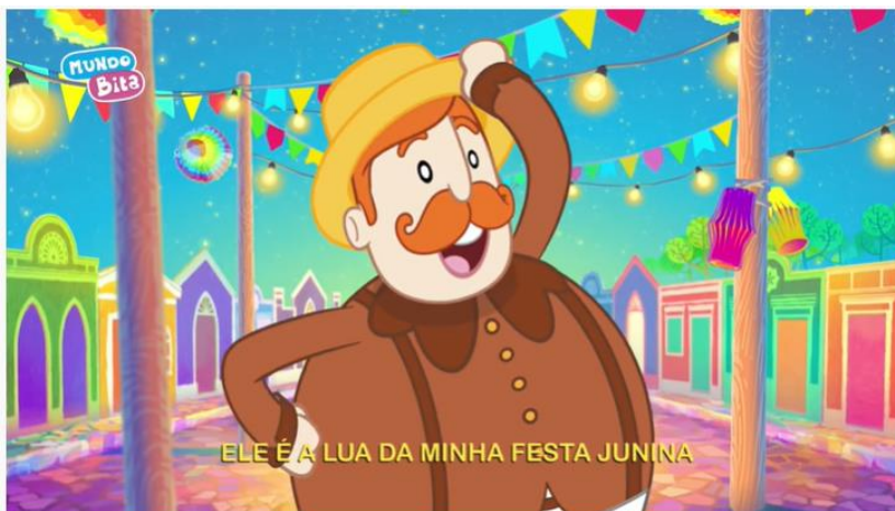
Mundo Bitá - São João do Bitá [clipe infantil]

https://www.youtube.com/watch?v=ueTMLzcYcu0