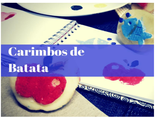
Carimbos de Batata

Uma maneira de fazer um belo passatempo com as crianças é fazer atividades com carimbos feitos de batata.