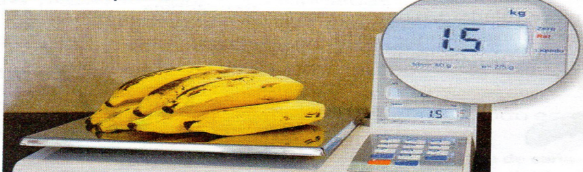
Bananas sendo pesadas.