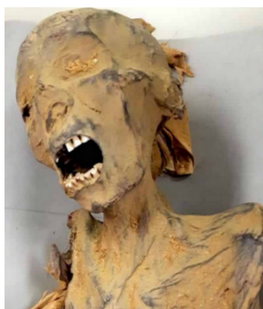
2: Múmia egípcia (3 mil anos)

1: Lei Áurea : “Art. 1.º - É declarada extinta a escravidão no Brasil. // Art. 2.º - Revogam-se as disposições em contrário. 13 de maio de 1888”. (MAIOR, A. Souto, 1968, p. 338.)