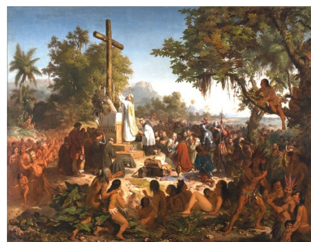
4: Primeira missa no Brasil (1860).